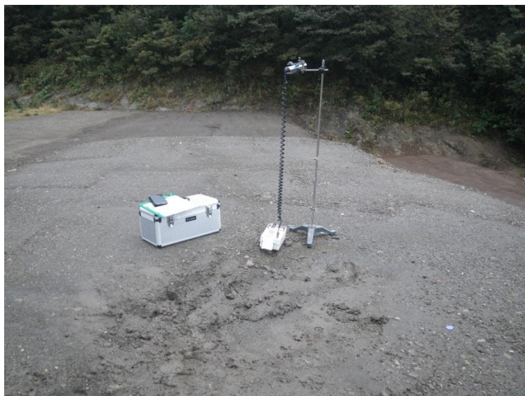
地上高 1 m地点