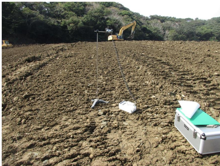
地上高 1 m地点