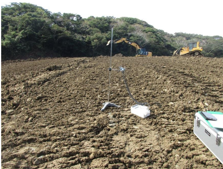
地上高 50cm 地点