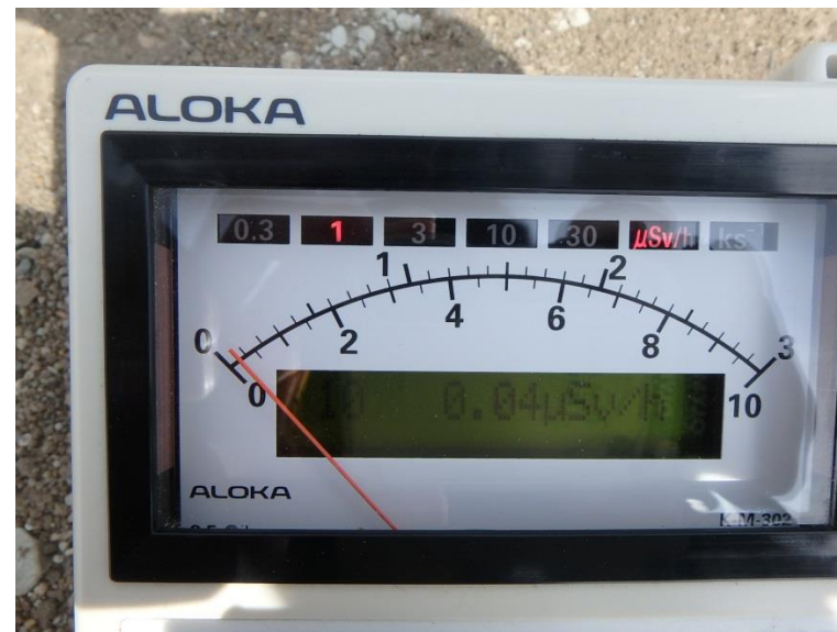
地上高 1 m地点 測定値 (平均値)