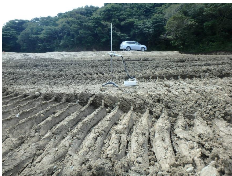
地上高 50cm 地点