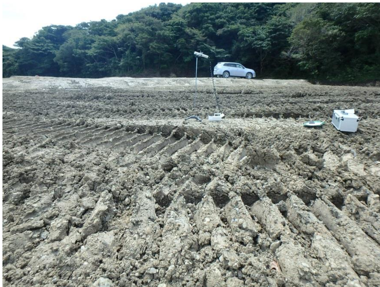
地上高 1 m地点