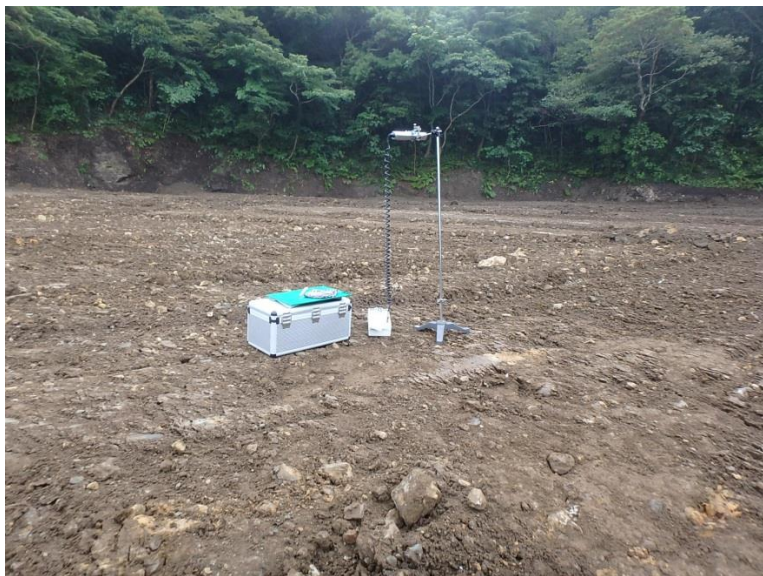
地上高 1 m地点