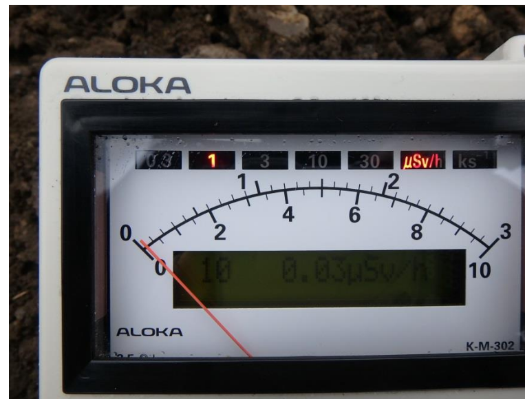
地上高 1 m地点 測定値 (平均値)