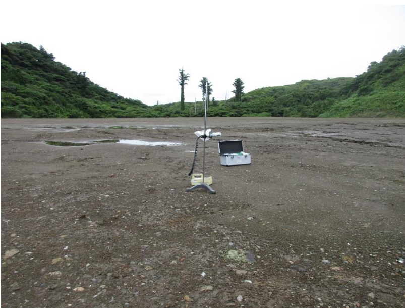
地上高 50cm 地点