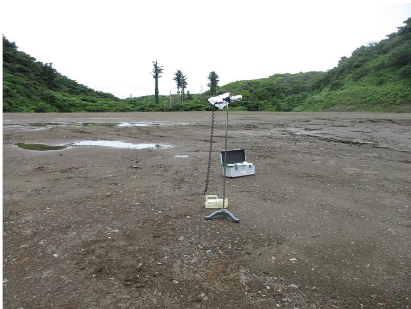
地上高 1 m地点