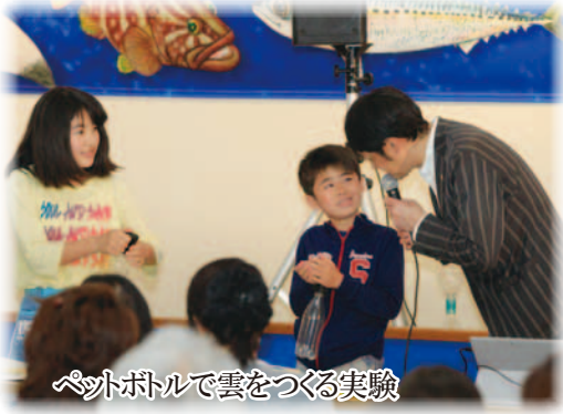
ペットボトルで雲をつくる実験