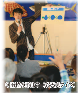
Q雨粒の形は？（お天気クイズ）

「館山お天気大使」の委嘱に合わせ、「渚の駅」たてやまで開催された「お天気キャスター吉田ジョージのお天気クイズと実験トークショー」では、ペットボトルを使った実験で、雲ができる仕組みを子どもたちにわかりやすく解説しました。