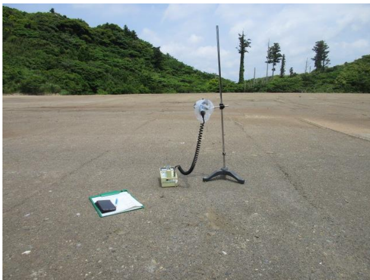
地上高 50cm 地点