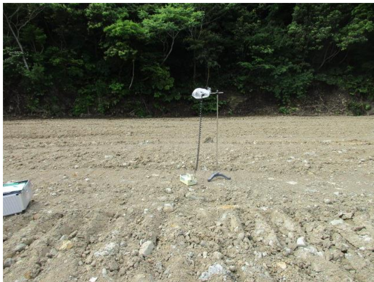
地上高 1 m地点