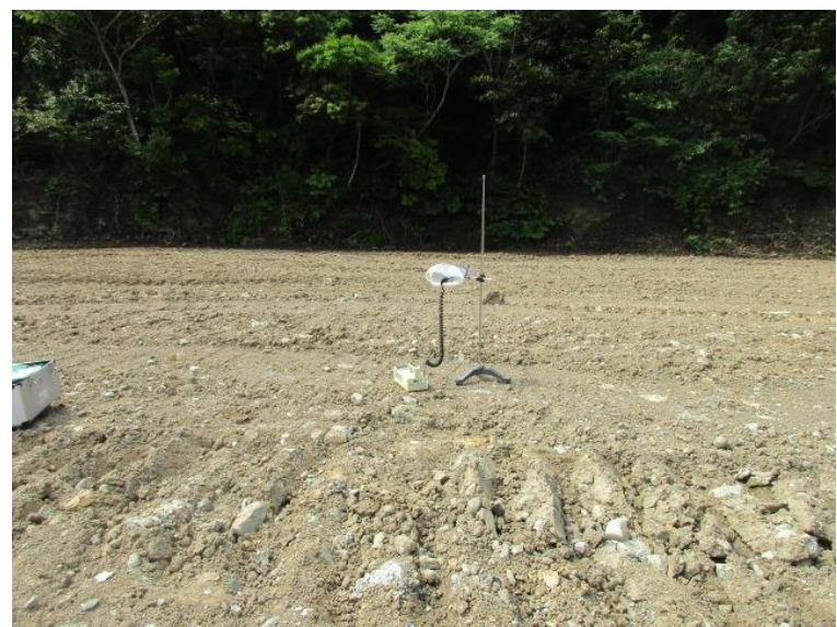
地上高 50cm 地点