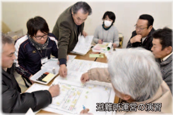
避難所運営の演習

研修は、コミュニティセンターで2日間行われ、地震や津波、土砂災害といった自然災害の特徴など、専門的な講義から、災害時に自主防災会が担う避難所の運営等の演習、さらには家庭で出来る防災対策を学んだほか、普通救命講習も含まれる実践的なものでした。