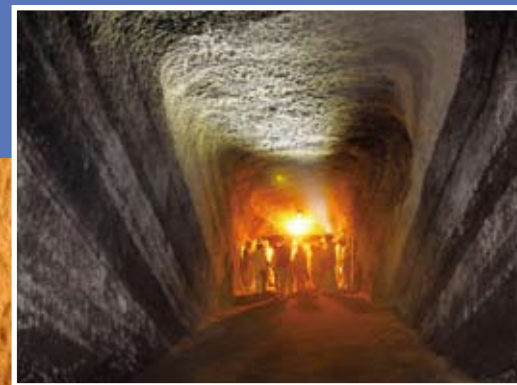
壕内の照明は太陽光発電を利用しています

みなさん、赤山地下壕跡へようこそ。今から地下壕の探検が始まります。 赤山地下壕跡は、館山市の歴史だけではなく、土地のおいたちも教えてくれます。 房総半島南部の丘陵は、新生代第三紀という比較的新しい年代(とはいっても、およそ2,400万年前より新しい地層ですが。)の凝灰岩質の砂岩や泥岩など、やわらかい地層が重なりあい形成されています。 壕の中で、次の3つのポイントをもとに観察してみてください。