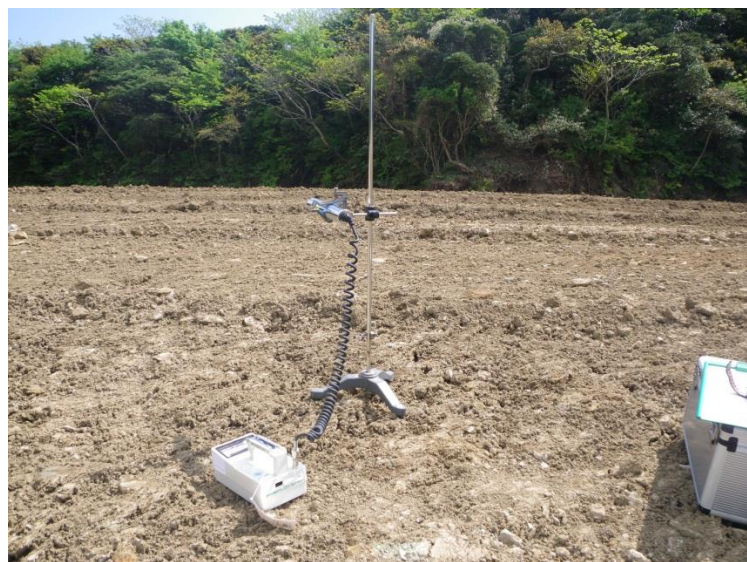
地上高 50cm 地点