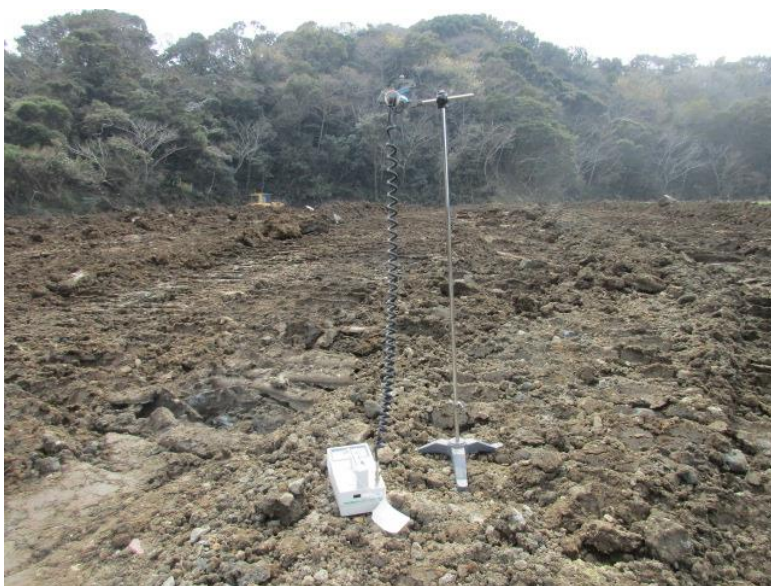
地上高 1 m地点