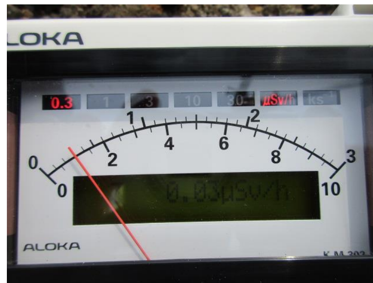
地上高 1 m地点 測定値 (平均値)