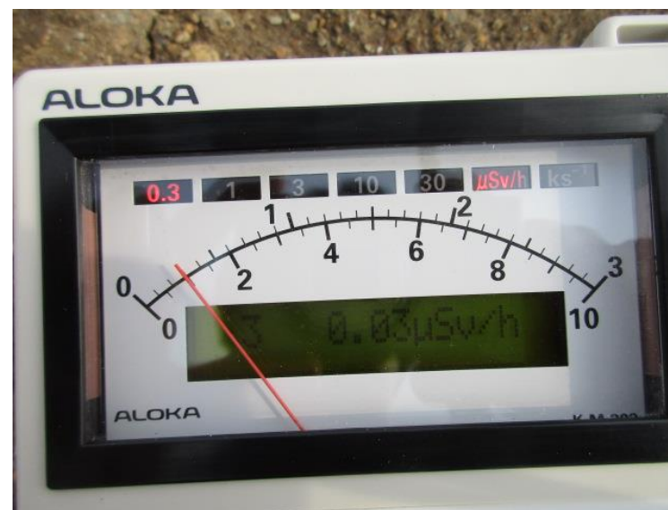
地上高 1 m地点 測定値 (平均値)