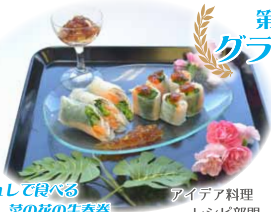
梅ジュして食べる 菜の花の生春巻 (上野友菜さん)