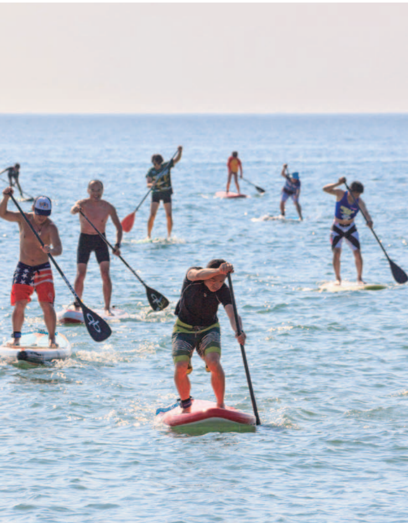
Let's get out with SUP!! 海上玩立槳衝浪 海上玩槳板衝浪 SUP로 바다에 나가자