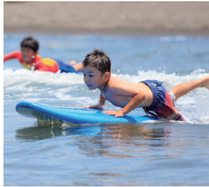
Let's challenge Bodyboarding!! 挑戰趴板衝浪 挑戰趴板衝浪 보디보드에 도전