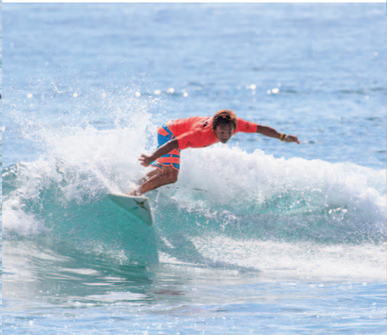
Let's go surfing in Heisaura!! 在平砂浦衝浪 在平砂浦衝浪 서핑은 헤사우라에서