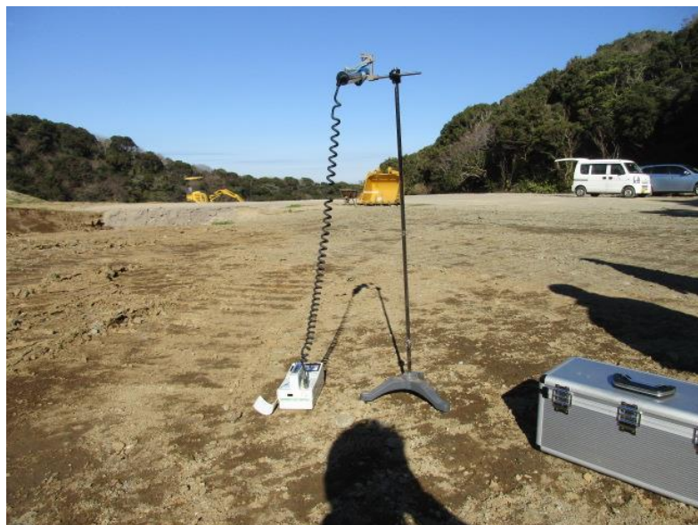
地上高 1 m地点