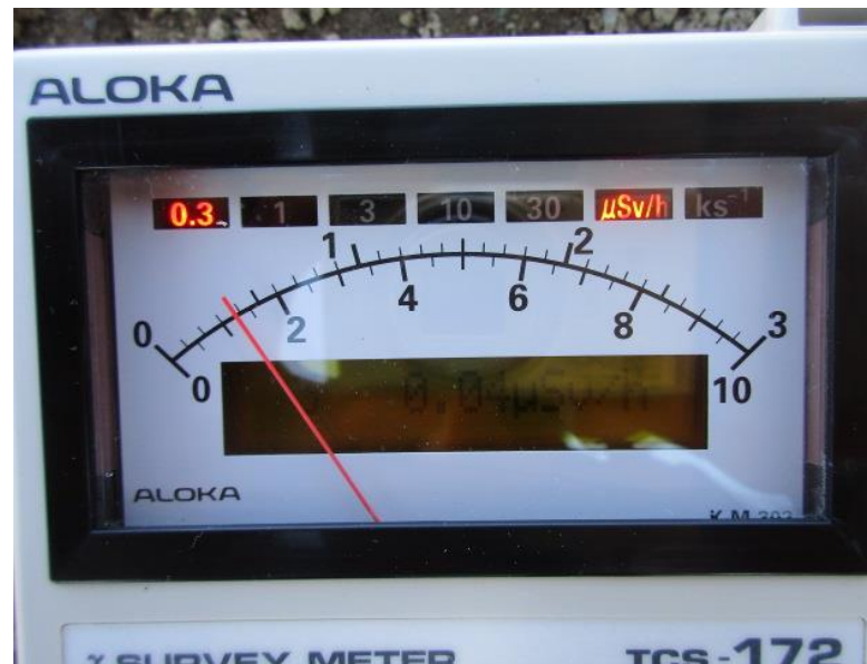
地上高 1 m地点 測定値 (平均値)