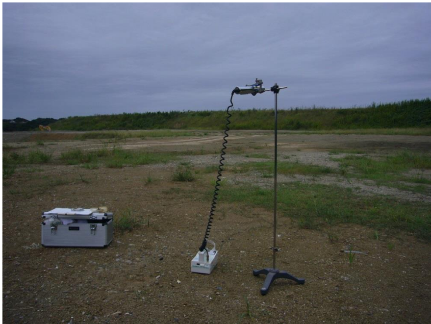
地上高 1 m地点