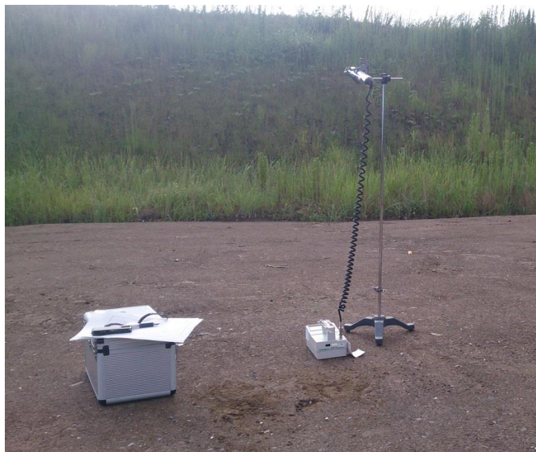
地上高 1 m地点