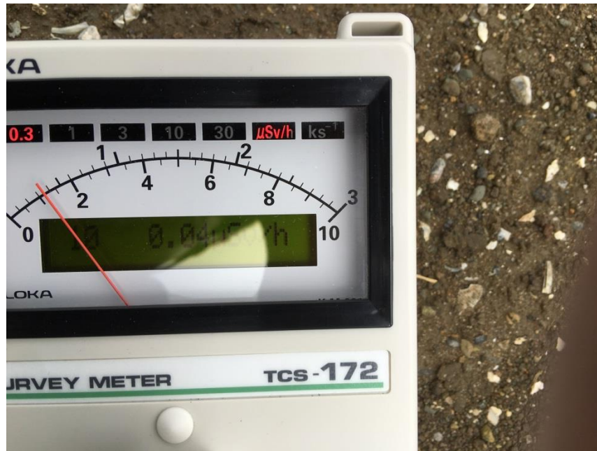
地上高 1 m地点の測定値 (平均値)