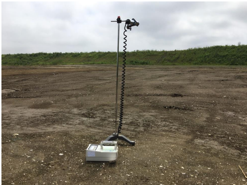
地上高 1 m地点