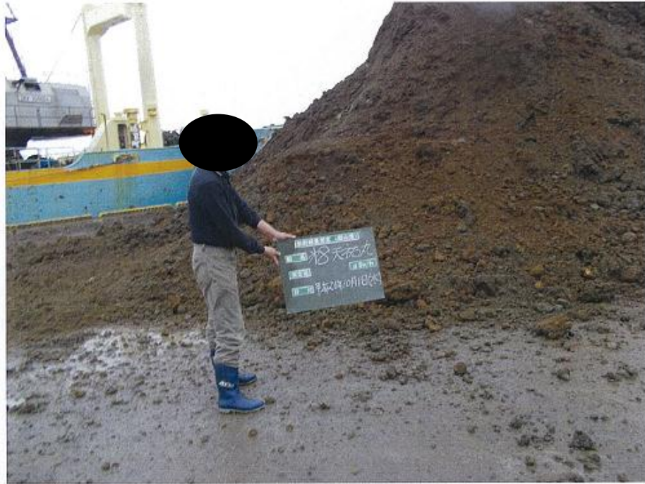
第8天祐丸 平成26年10月1日（水）