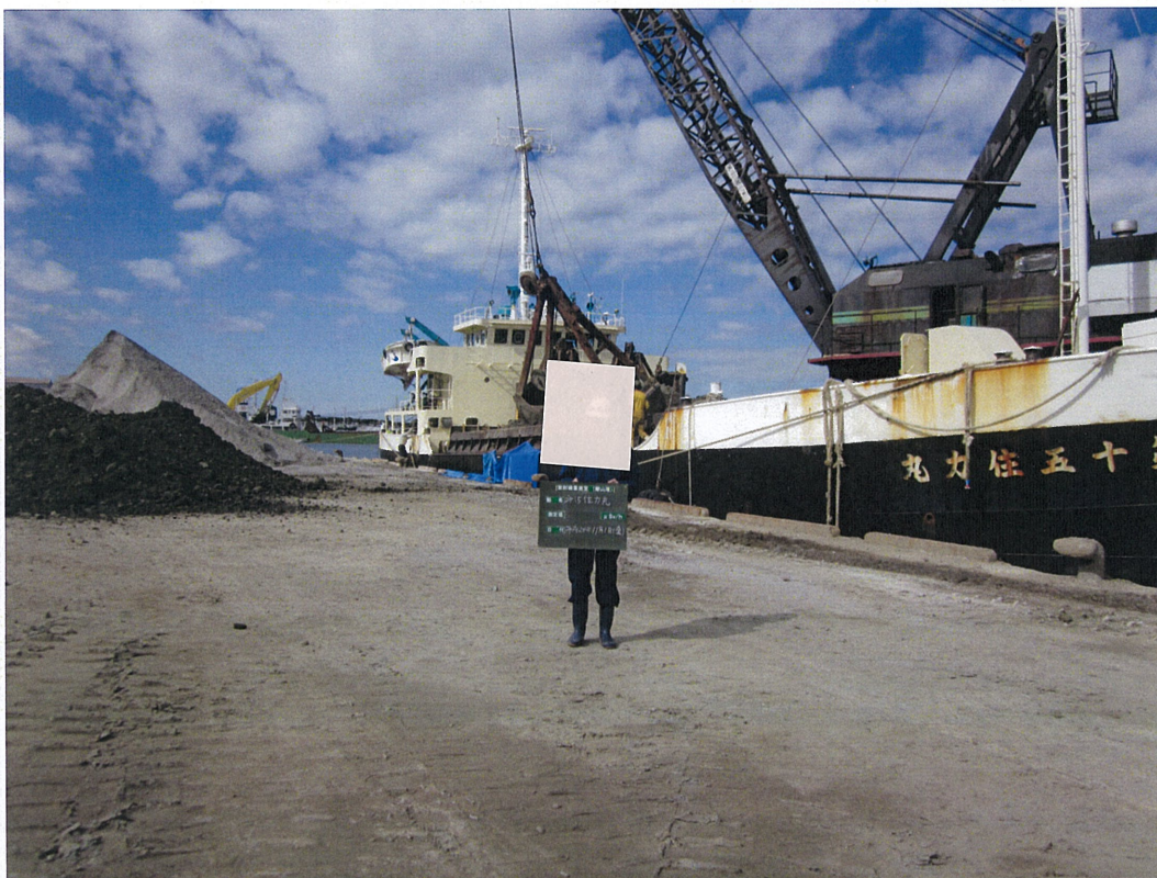
第15住力丸 平成24年11月2日(金)