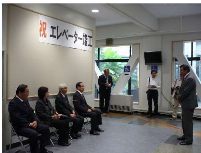
庁舎エレベーター開通式