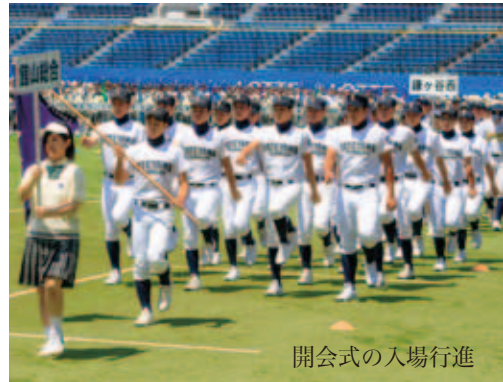
開会式の入場行進