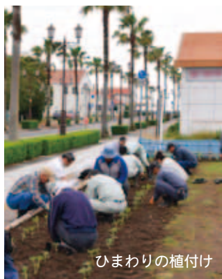
ひまわりの植付け