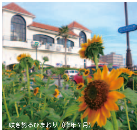
咲き誇るひまわり（昨年7月）

5月に植えた「ひまわり」は8月の花火大会頃には大輪を咲かせ、訪れる大勢の人たちを元氣いっぱいに出迎えてくれることでしょう。