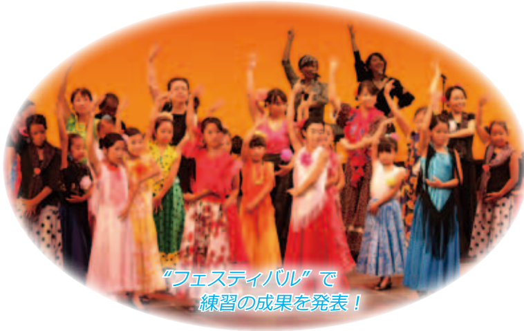
“フェスティバル”で 練習の成果を発表！

日時／① 7/10 (日) 10:30～12:15 ②・③ 7/17・31 (日) 10:40～12:10 ④ 8/6 (土) 12:00～16:00 講師／全国学生フラメンコ連盟の卒業生の皆さん 会場／コミュニティセンター3階 軽運動室など 募集人員／親子など15組30人 対象／4月1日時点で5歳以上の幼稚園児・保育園児、小学生とその保護者で、全4回の教室と8/7(日)のフェスティバルに参加できる人