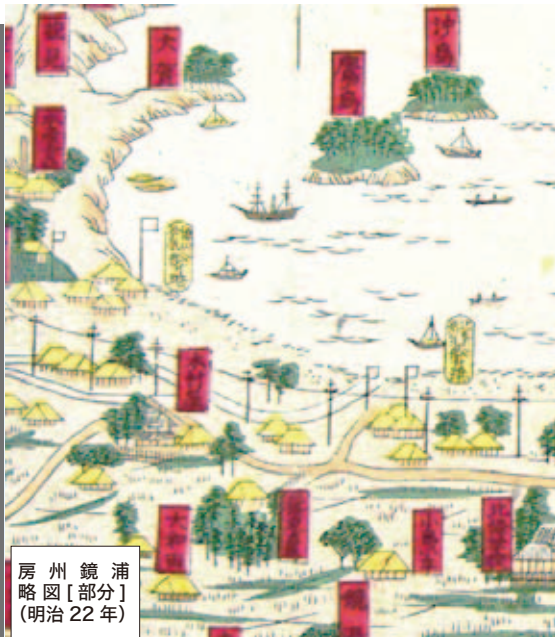
浦鏡州房 略図[部分] (明治22年)

皆さんは、館山から東京へ行く際、どのような交通機関を利用するでしょうか。現在では、高速バスや鉄道などの手段がありますが、明治時代までは館山から東京への主な交通手段は船でした。最初に東京―房総間で汽船