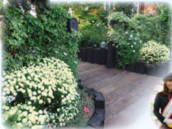
【写真：右】入賞者の皆さん (H28.1.24 ファミリーパークにて)