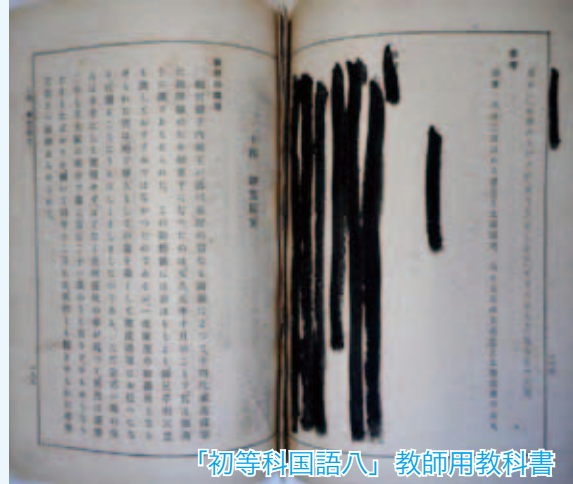
「初等科国語八」教師用教科書

写真は、昭和18（1943）年に発行され、戦後も使用されていた初等科教師用の国語の教科書です。墨で塗られた