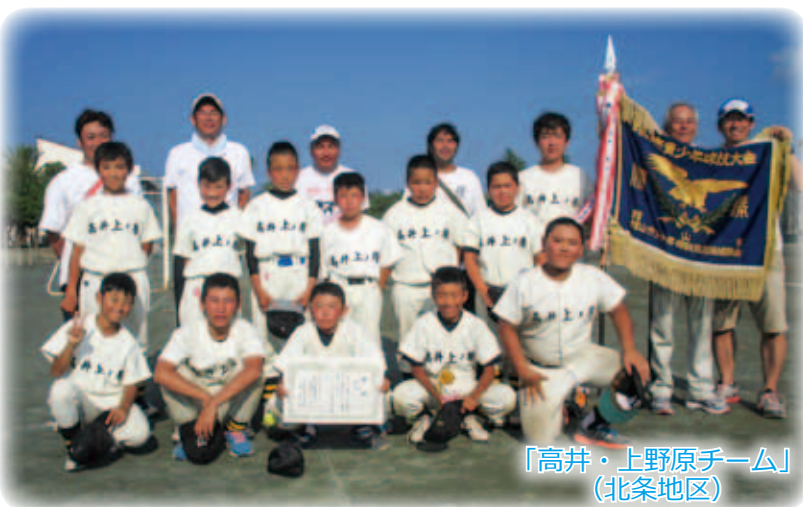
「高井・上野原チーム」 (北条地区)

皆さんが調査票を記入・提出する際の負担を軽減するため、これまでの「紙の調査票」による調査に加えて、「オンライン回答」を導入します。