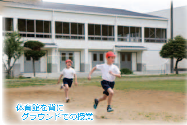
体育館を背に グラウンドでの授業