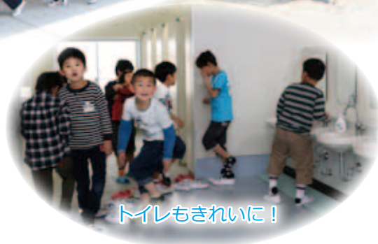
トイレもきれいに!