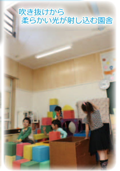
吹き抜けから 柔らかい光が差し込む園舎

5月末に 申請書 と 現況届 を送付しました。 (子育て世帯臨時特例給付金) (児童手当) 忘れずに提出を！