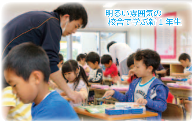
明るい雰囲気 の校舎で学ぶ 新1年生