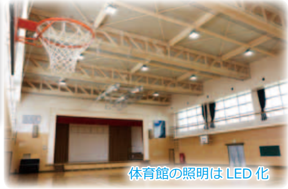
体育館の照明はLED化