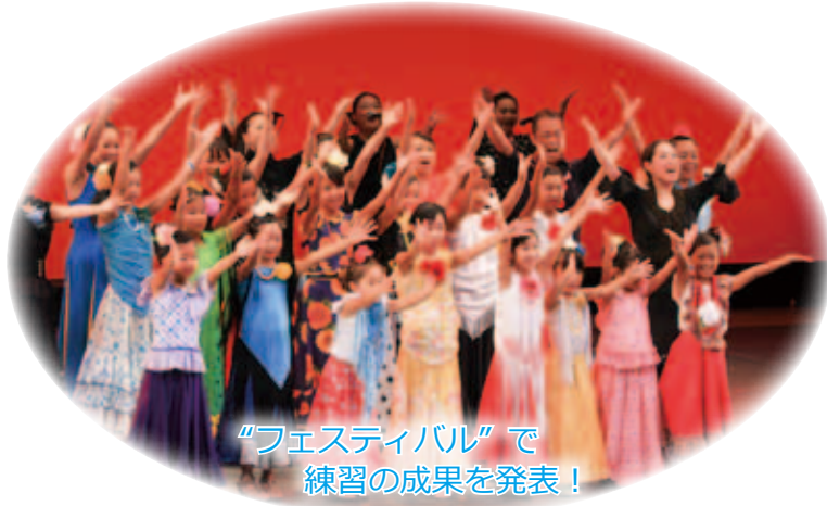
“フェスティバル”で 練習の成果を発表！

申込方法／EメールまたはFAXで、①代表者の住所・氏名・電話番号、②参加希望者の氏名・年齢（学年）・性別を申込み先まで。