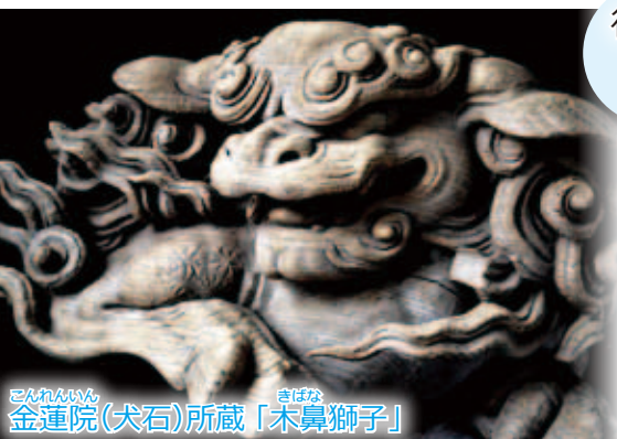
金蓮院(犬石)所蔵「木鼻獅子」