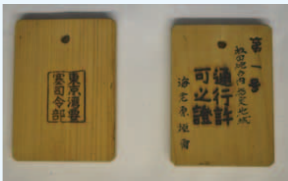
▶坂田砲台内通行許可之証 (海老原斉氏蔵 当館保管)

また、関東大震災によって土地が隆起したことで、高ノ島・沖ノ島と陸地の間が浅瀬になり、その土地を埋め立てて、滑走路として利用した館山海軍航空隊が昭和5(1930)年に設立されました。昭和16(1941)年6月1日には神戸村(現在の市内神戸地区)に館山海軍砲術学校も開校し、軍の存在感が大きくなります。