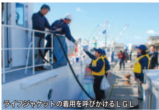
ライフジャケットの着用を呼びかけるLGL

LGLの活動は、海で働く家族に「無事に帰って来て」という願いを込め、陸で待つ女性の立場からライフジャケットの常時着用を直接呼びかけることで、海