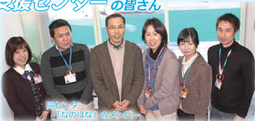
同センター 「なのはな」のメンバー