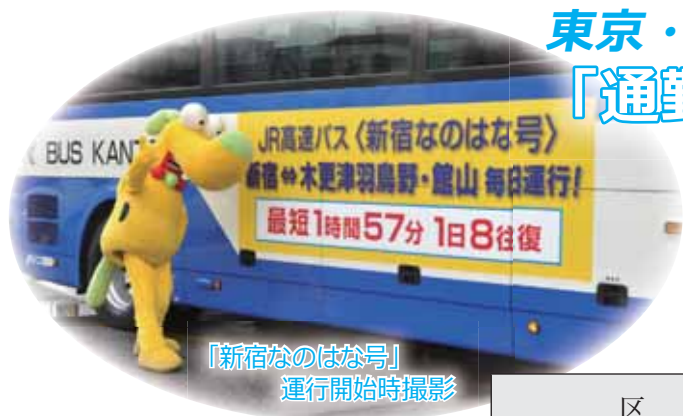
「新宿なのはな号」 運行開始時撮影

3月14日のダイヤ改正に合わせ、「通勤・通学定期券」が導入されたほか、一部便の時刻や運賃の改正、運行時間の短縮(新宿まで最短1時間47分)が図られました。