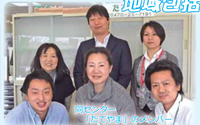
同センター 「たてやま」のメンバー