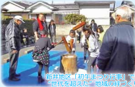
新井地区「初午まつり行事」で “世代を超えた”地域の絆づくり