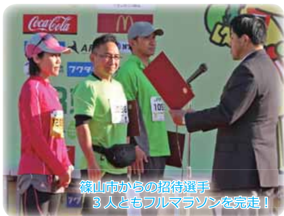
篠山市からの招待選手 3人ともフルマラソンを完走！