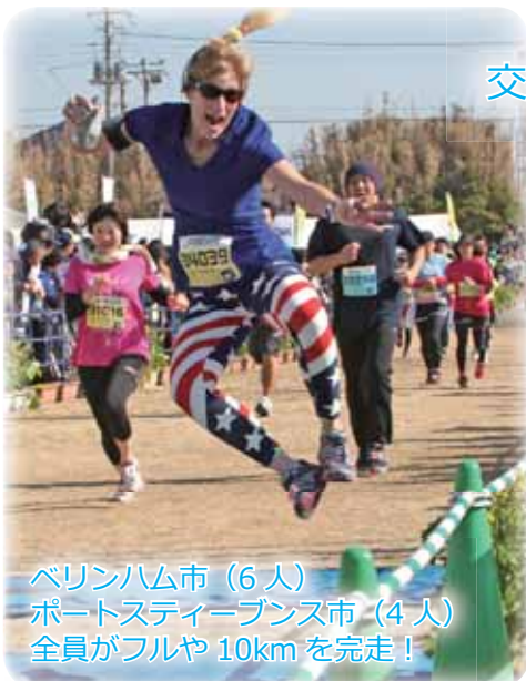
ベリンハム市（6人） ポートスティーブンス市（4人） 全員がフルや10kmを完走！