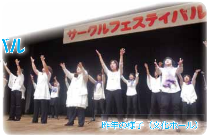
昨年の様子（文化ホール）

【南総文化ホール（8日のみ）】各種ダンス、人形劇、マジック、村歌舞伎、合唱サークルなどの発表