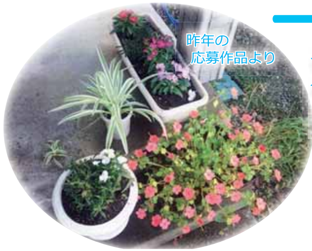
昨年の 応募作品より