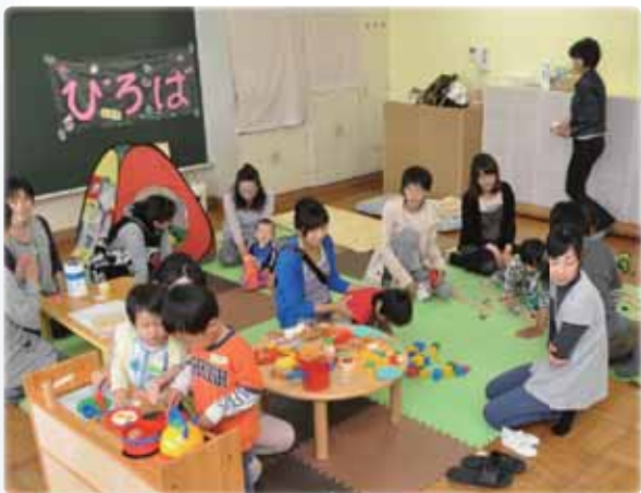
5月 「出張子育てひろば」を船形こども園に開設 「元気な広場」利用者は延べ16万人に!