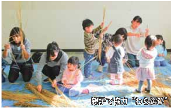
親子で協力 “わら選び”

「家族みんなでもものづくり 〜とお正月のお飾りを作ろう 〜」と題し開催した、子育て を応援する講座「ハッピー ファミリー」には、21組の親 子が参加して、「お正月飾り」 の作製に挑戦しました。