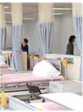
福祉専門学校「第一期生49 “地域の看護師”確保へ