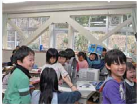
2月 西岬小・館野小(写真)で耐震工事了 引き続き3小学校、1園で改修工事中