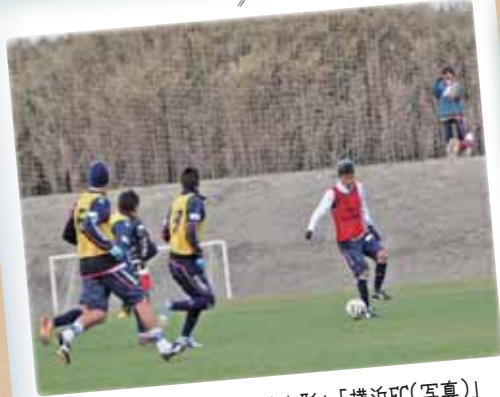
2月 「モンテディオ山形」「横浜FC(写真)」 プロサッカーチームが相次いで“館山キャンプ”