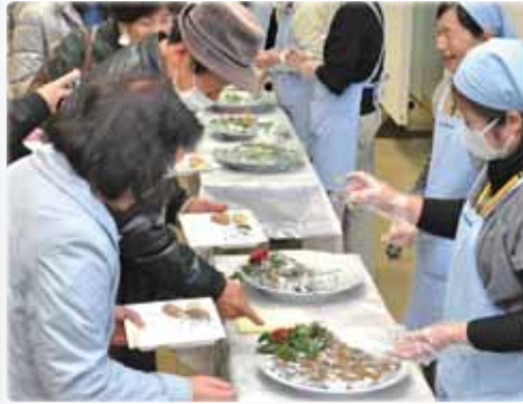
1月 「食のまちづくりシンポジウム」開催 保健推進員による地産地消料理の試食も