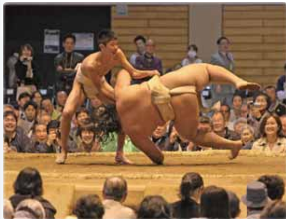
4月 市制施行75周年記念「福祉大相撲館山場所」 “ちびっこ力士”が、遠藤関を上手投げ!