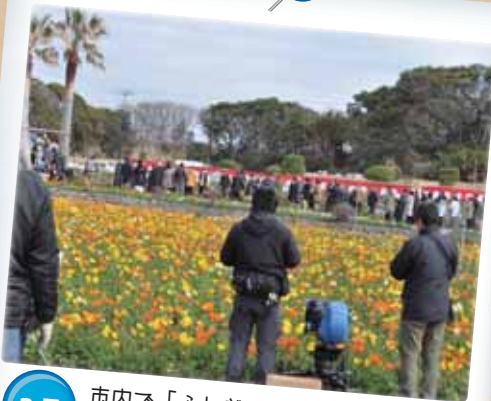
3月 市内で「ふしぎな岬の物語」撮影 モントリオール世界映画祭でダブル受賞