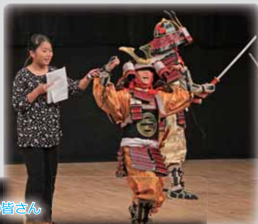
里見氏に関する学習の成果を発表した 北条小学校 6 年 2 組の皆さん