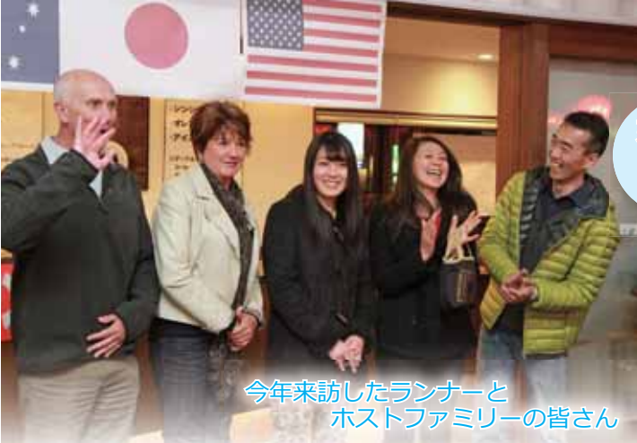
今年来訪したランナーと ホストファミリーの皆さん