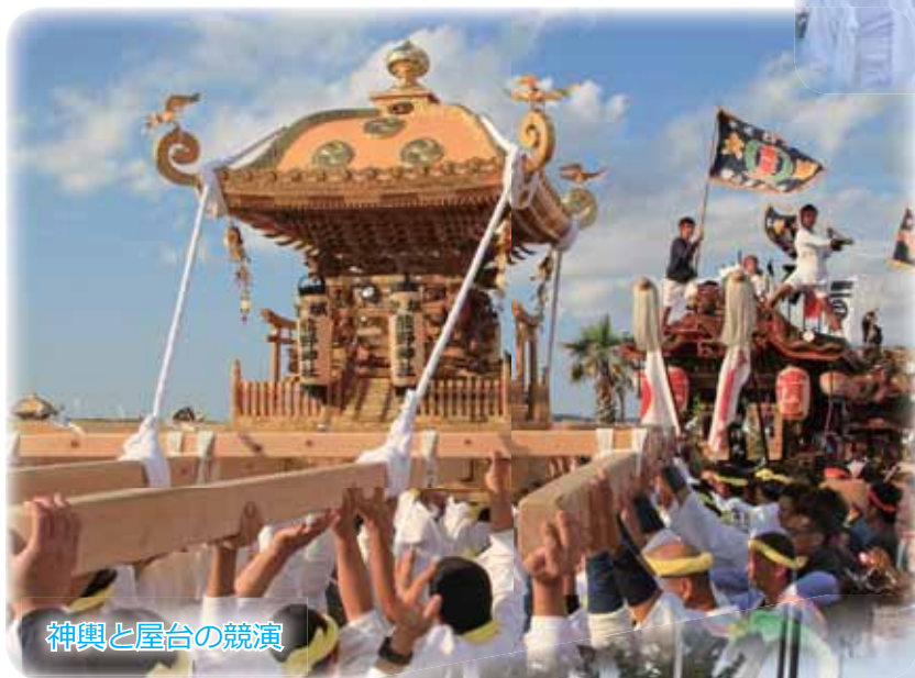
神輿と屋台の競演