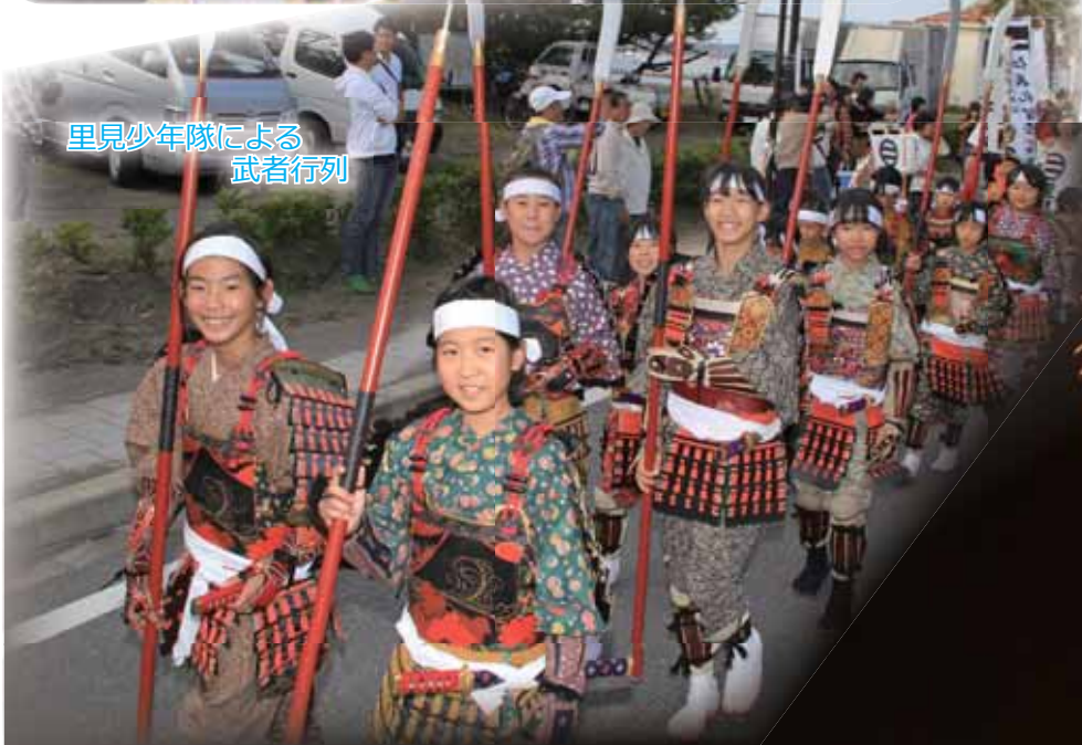
里見少年隊による武者行列

今年は、「館山市制施行75周年」「里見氏安房国替400年」「里見八犬伝刊行開始200年」を記念する節目の年の開催となり、空高く澄み渡る秋空の下、武者行列が勇ましくパレードコースを練り歩き、市内各地から集結した27台の御船・山車・屋台・神輿による競演、北条海岸では戦国合戦絵巻が繰り広げられるなど、戦国時代が蘇りました。