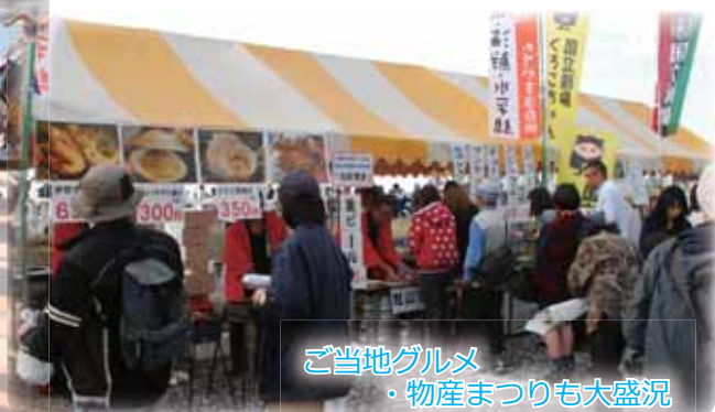
ご当地グルメ ・物産まつりも大盛況