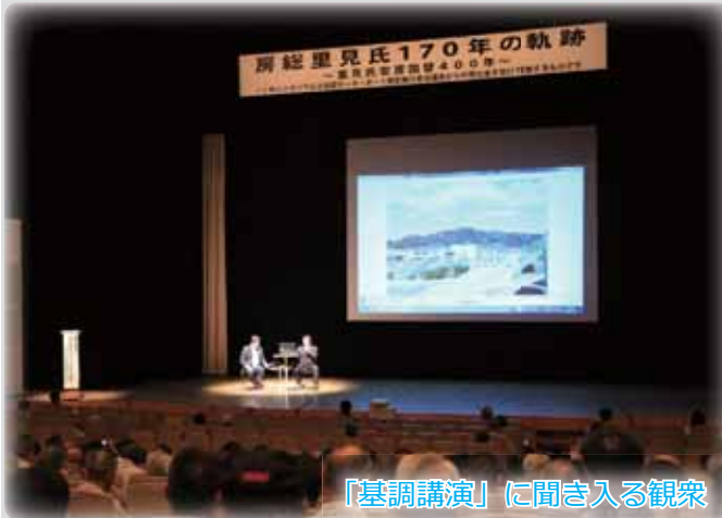
「基調講演」に聞き入る観衆