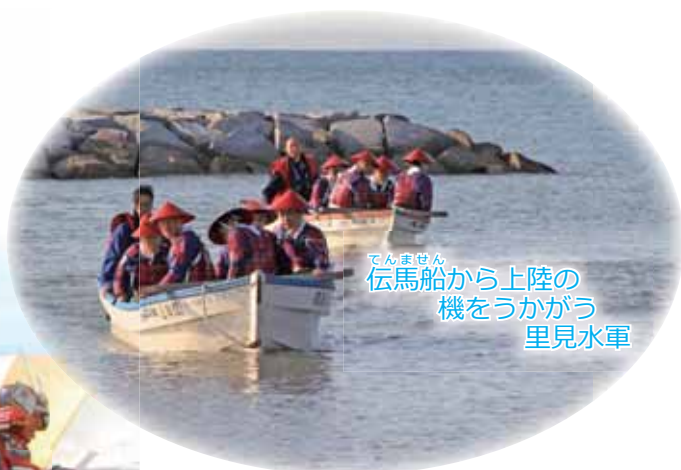
てんません 伝馬船から上陸の 機をうかがう 里見水軍