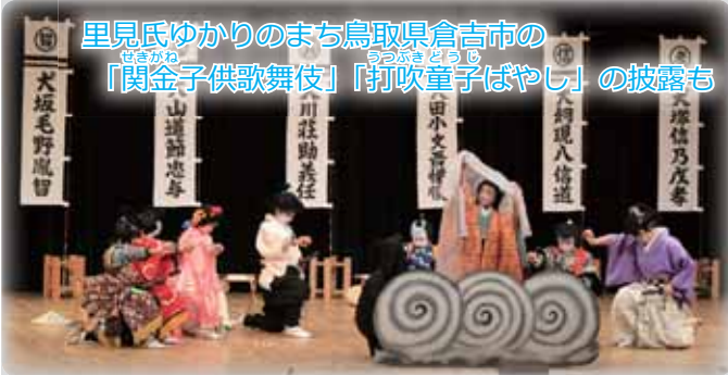
里見氏ゆかりのまち鳥取県倉吉市の 「関金子供歌舞伎」「打吹童子ばやし」の披露も