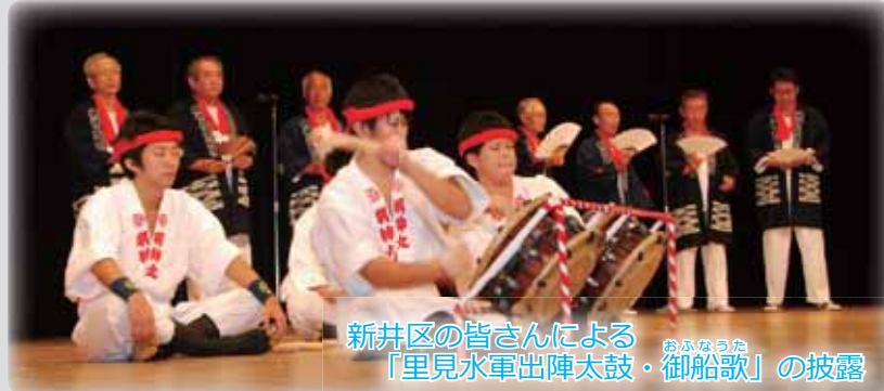
新井区の皆さんによる 「里見水軍出陣太鼓・御船歌」の披露