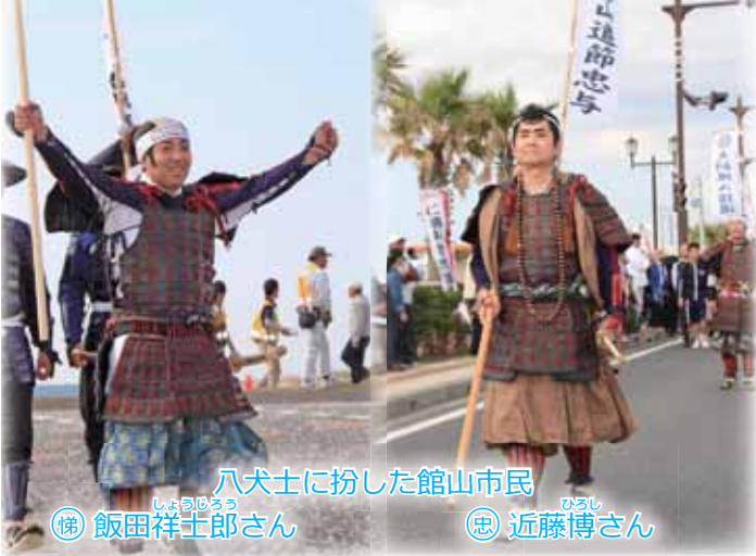
八犬士に扮した館山市民