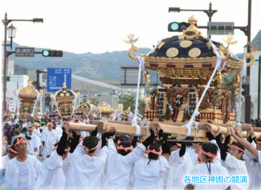
各地区神輿の競演