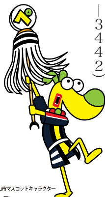
船山市マスコットキャラクター