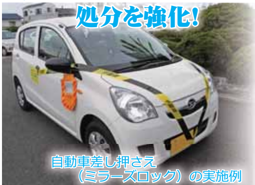
自動車差し押さえ(ミラズロック)の実施例