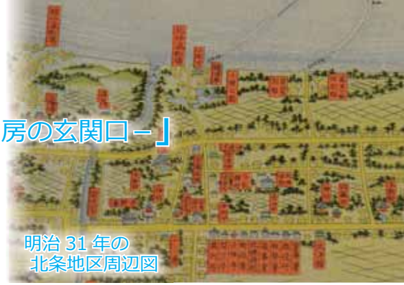
明治31年の北条地区周辺図

“安房の玄関口”としての成り立ちと、古墳時代の遺跡や地区にまつわる伝承など、人々や物資・情報が集いにぎわうまち、北条地区の歴史を紹介します。