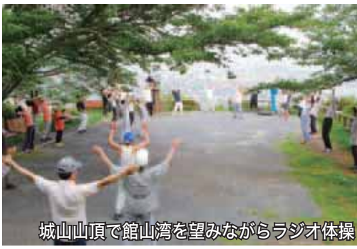
城山山頂で館山湾を望みながらラジオ体操

わし世間話をしながら、城山の坂道を登り、中腹まで来ると山頂からラジオ放送が聞こえてきます。お決まりの散歩コースを回って山頂に着くと、毎日決まって浅間神社でお参りする人も