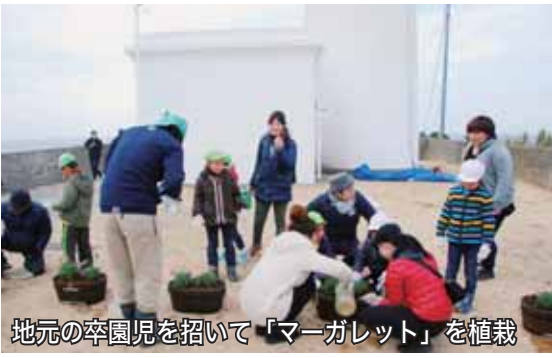
地元の子園児を招いて「マーガレット」を植栽

当時のように、「洲埼灯台周辺をお花でいっぱいにしてよう！」と、平成24年、若者を中心に結成した「洲埼マーガレット岬の会」の会員数は現在57名。館山の豊かな自然を守り伝えていくというこの会ではこれまで、