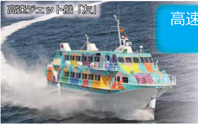
高速ジェット船「友」