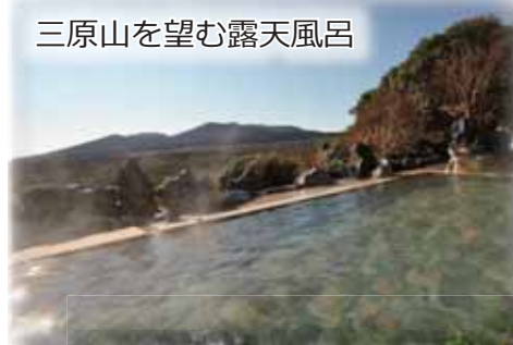
三原山を望む露天風呂

なお、館山日東バス(株)では、高速ジェット船の運航にあわせ、館山駅西口から客船ターミナルのある「“渚の駅”たてやま」間を結ぶ路線バス「観光棧橋線」を運行する予定です。