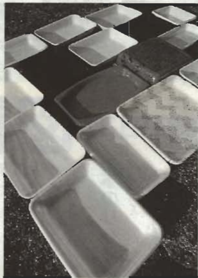
▲色・柄のついたトレイは対象外