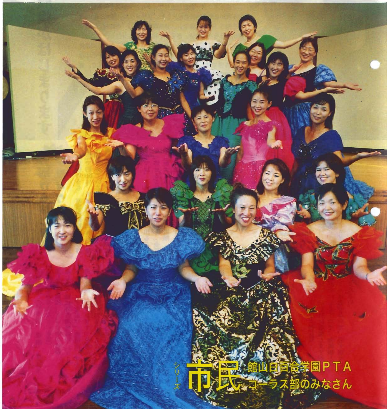
シリーズ 市民 館山白百合学園PTA コーラス部のみなさん