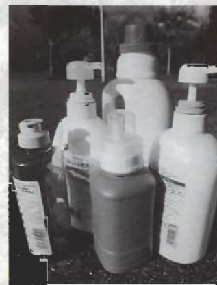
▲ペットボトルのマークがついていない容器は対象外

※プラスチック製のキャップは燃せるごみの日に、金属製のキャップは金属類の日に出してください。