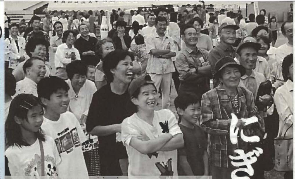
『イキイキ健康&産業まつり』が1日(日)、市コミュニティセンターと県南総文化ホールを会場に開かれ、約2万8千人の人出でにぎわいました。