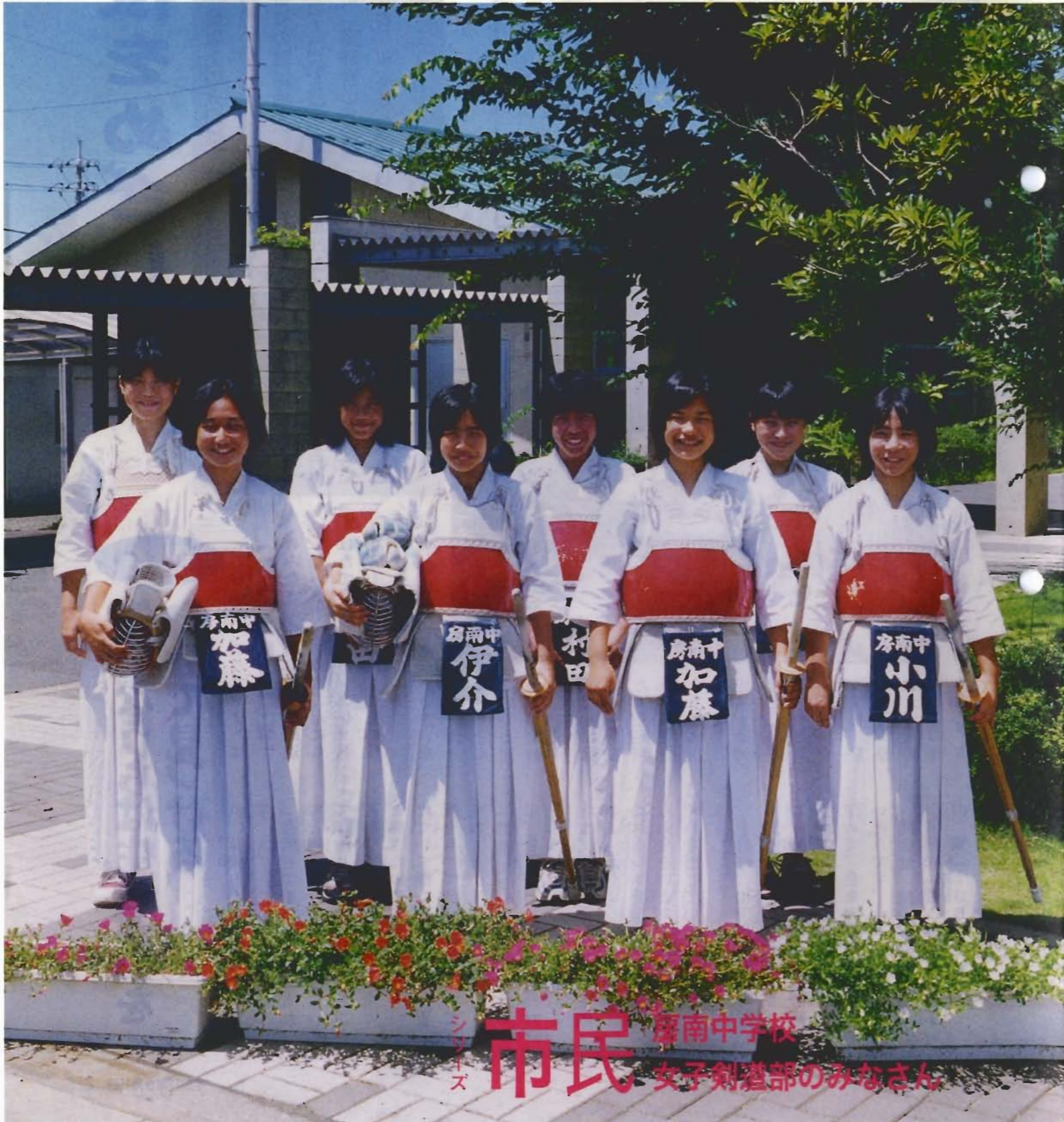
シリーズ 市民 南中学校 女子剣道部のみなさん