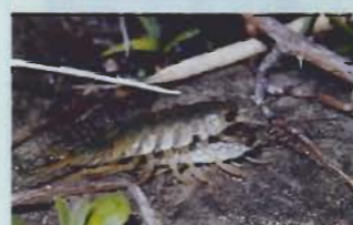
▲フナムシのカップル

人気のない夜の浜辺を歩くと、足元でぞろぞろ動き回る小さな甲殻類に気がつく。 庭や畑にいるダンゴムシと良く似たハマダンゴムシとヨコエビ類のヒメハマトビムシである。ともに高潮線付近より上の砂中に穴を掘って住み、夜になると穴から出て活動する。流れ着いた海藻やごみに群がりせっせと食べるため、私たちにしてみれば願ってもない掃除屋さんといえるだろう。昼間、浜辺の高いところに群れているフナムシも、ハマダンゴムシとは親戚で、夜になると水辺に移動して餌をとる。彼らは死んだ動物なども食べるため、浜辺の嫌われ者扱いを受けているようだが、実は自然浄化に役立つ大切な役割を果たしているのである。