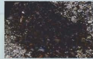
▲ヒメハマトビムシ