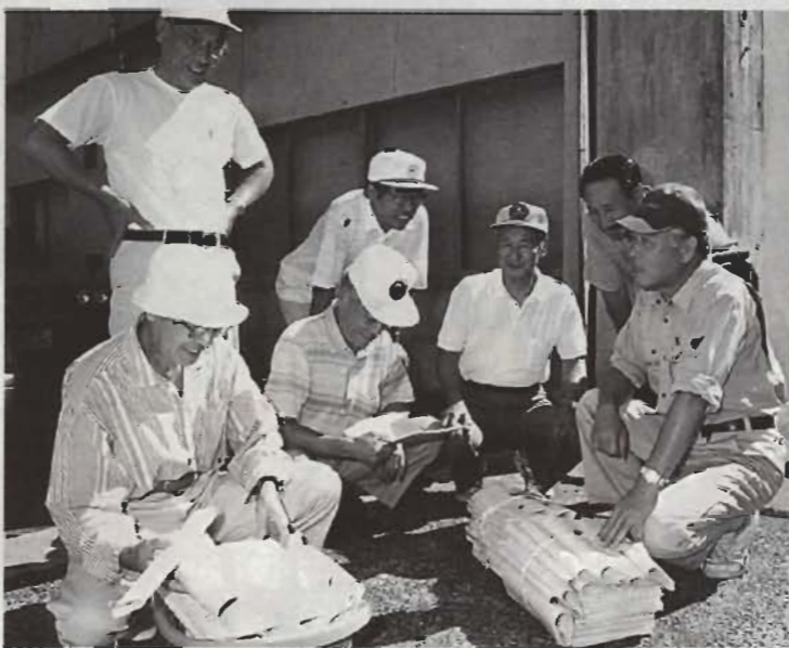
▶ さあ今日も元気に！広報の配達へいざ出発

「楽しんで、生きがいをもっと働きたい」そんな思いと社会参加をめざして、平成2年に発足しました。発足当時9人だった会員も現在は85人。広報や回覧の配達、海岸清掃や北条海岸のトイレ清掃、駐輪場の整理、一般の人からの要請で草取