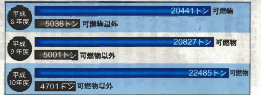
▲ごみ搬出量の推移