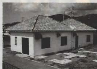
▲那古地区生活排水処理施設

これらの処理水BOD値は、20mg/l以下となっております。なお、同補助制度の概要は次のとおりです(平成11年度の補助基数は125基です)。 補助対象建築物/住宅または店舗等に併設された住宅 補助対象小型合併浄化槽/処理対象人員50人以下のもの 補助対象区域/下水道事業の認可区域以外