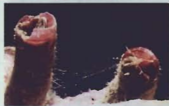
▲粘液糸を口に運ぶ