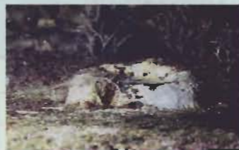
▲クモの巣のような粘液糸

巻き貝といえば大きな腹足で這い回るのがふつうであるが、この貝は自ら這うのをやめてしまい、岩の表面で固着生活をする変わり種である。餌の取り方も生殖方法も固着生活によく順応している。波の静かな潮だまりをのぞいて、その変わった生態を観てみよう。