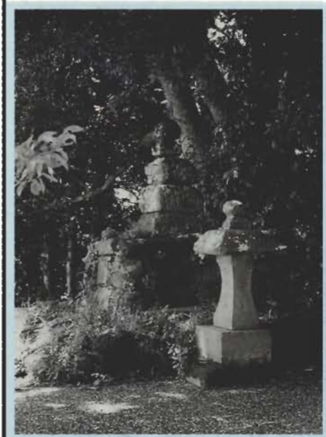
新たに「式部夢山道」として整備された式部塚

那古寺観音堂の墓山(通称シキビシ)は昔から絶景の地として知られ、海抜約70メートル余の高さの山頂は、潮音台と呼ばれる展望台となっています。 波静かなことから「鏡が浦」とも愛称される館山湾を一望に見渡すことができ、地元の人々だけでなく、遠来の観音巡礼の人々からもこの眺めは愛され、多くの歌人、文人墨客の詩歌に詠まれています。