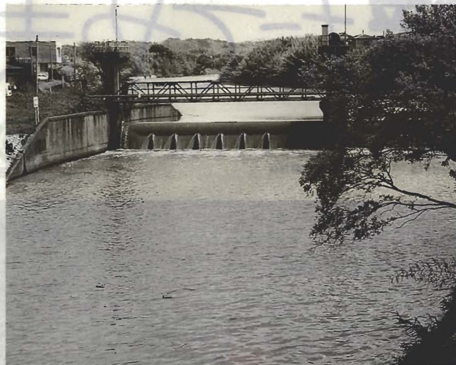
▲平久里川、平成橋付近

私たちの暮らしをとりまく大気や水、土壌、森林の緑などの自然環境は、人々が生活していくうえで最も大切なものであると同時に、すべての生き物にとってかけがえのないものです。しかしながら、産業や経済の発展に伴い、私たちの生活が便利になる一方で地球の温暖化やオゾン層の破壊、熱帯林の減少、酸性雨などさまざまな環境問題が発生しています。これらの環境問題への取り組みは、行政と市民、事業者の三者が一体となって進めていくものです。