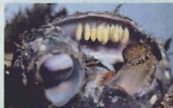
▲雌の殻につり下げられた卵嚢

動けないため生殖行動にも特別な方法をとっている。海中に流れ出した雄の精子が雌の殻の中に吸い込まれ、受精が行われる。雌は産卵期になると首の横に溝ができ、自分の殻との間にできた隙間に卵嚢をつり下げられるようにして産み付ける。卵嚢の中には受精卵とともに別の栄養細胞が入っていて、孵化した幼生はその細胞を食べてむだなく成長し、やがて海中に泳ぎ出す。母親に守られた卵嚢は、幼生にとってはまるでお弁当を備えたゆりかごのようなものである。(小池康之)