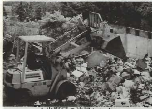
▲出野尾の清掃センター

市内に家庭や事業所などから出されるごみの量は、平成10年度で年間約2万7千トン。1日に約74トン、赤ちゃんからお年寄りまで(52,856人、住民基本台帳人口、外国人を除く)の一人ひとりが、毎日約1.4kg(即約28個分)のごみを搬出していることとなります。