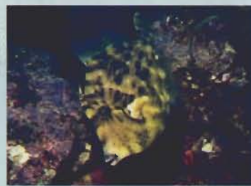
▲おちよほ口と鋭い歯

この愛嬌のある顔をした魚は フグ類の遠縁で、本州中部以南 の沿岸に分布し、岩礁近くの砂 場にすむ。初夏のうち流れ藻に ついた幼魚は、やがて砂浜の藻 場に移動して成長する。ここ館 山湾の藻場も、彼らを育む大切 な役目を果たしているのではあ る。成長すると、おちよほ口の 先についた鋭い歯を使い、餌を 小さく食いちぎっては吸い込む ように摂餌する。この技で釣り 針から上手に餌だけとってしま うので、「餌とり名人」の称号