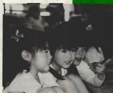
仲良しの3人 純真保育園で