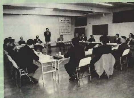
先月31日に開催された総合計画審議会

そして、施策の体系を①館山新世紀発展プラン、②ふるさと館山の保全と育成、③分権型社会のシステムづくりの3つに大別しました。