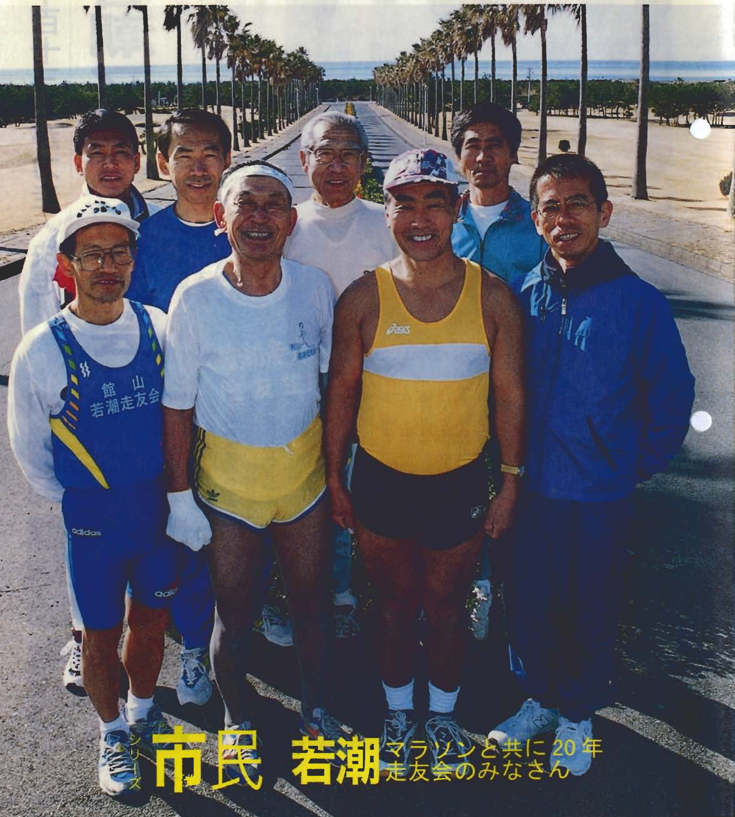
市民若潮 マラソンと共に20年 走友会のみなさん