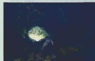
▲ナワバリ争い 勝者(左) 敗者(右)

を与えられている。これに負け じと、色々工夫を凝らして対抗 するあたりがカワハギ釣りの醍 醐味といえるのだろうか。旬は夏 といわれるが、大きな肝が鍋物 に合うため、寒い時期にも盛ん に釣られている。 水中で行動を観察すると、 ナワバリ意識が強いことが良く 分かる。二匹が近づくと互いに 黒い斑紋を浮き立たせるよう体 色を白く変え、相手を斜めにに らみながら攻撃する。負けた方 は体色を暗く落とし、斑紋も消 してすくすく逃げ去るのであ る。 それにしても「皮を剥ぐ」 という調理方法をそのまま名前 にしてしまうとは、学者も罪な ことをするものである。本人? が知ったら、たとえ餌とりの自 信があっても釣り餌には絶対に 近よらなくなるだろう。 (小池康之)