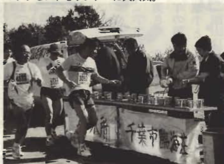
千葉県臨海荘のみなさんも職員総出で応援。今年「美菜」をサビッシュしました。