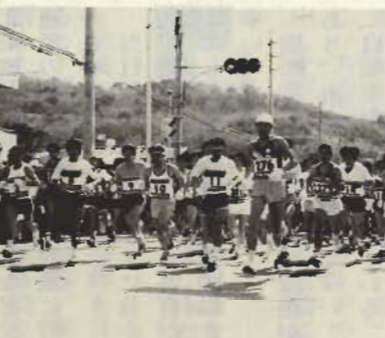
第1回若潮マラソン大会のスタート

「房南中には毎日のように通いましたね。どこを走るのか、コースの測定など走り回る毎日。房南中をスタート地点に、西岬を一周する20kmのコース。