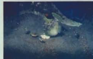
▲二枚貝を食いちぎる