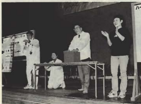
大盛況だった抽選会

前夜祭のフィナーレでは、「宿泊券」や「ふるさと小包」、「花鉢」などが当たる抽選会が行われ、会場を沸かせました。