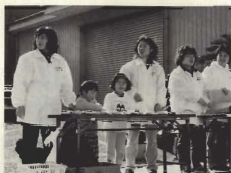
お母さんと一緒にちびっ子たちも応援

フルマラソンのコース沿道、7カ所の給水所で力走するランナーを応援しているのは婦人スポーツクラブのメンバー、総勢100人。