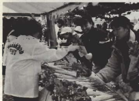
千葉市臨海荘のみなさんも職員総出で応援。今年「美菜」をサビッシュしました。

力走するランナーを励まし、かけながら天会を支えるのはボランティア800人。第1回大会から続く婦人スポーツクラブのメンバーによる給水所に加え、沿道には4カ所ほどの私設給水所も。ちびっ子たちも加わり家族総出の天支援。花と潮風の香りただよコースに人情もいっぱいです。