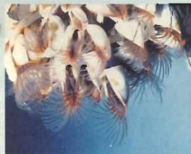
▲蔓のような足を広げるカルエボシ