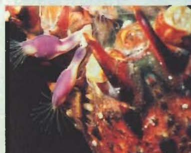
▲イセエビに付着したムラサキハダカエボシ

館山湾に北西の強風が吹き付ける季節になった。浜に打ち上がった流木などに群生しているエボシガイが良く見つかるのもこの時期である。この動物はくねくねと曲がる柄の上に鳥籠子の形に似た殻を持っているためこの名があり、貝の仲間と間違われるが、実はエビやカニと同じ甲殻類に属している。殻の隙間からのばした6対の蔓状の足