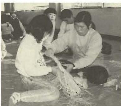
親子手づくりお飾り教室

来年のお正月は、手づくりのお飾りで。第2土曜日に開催。 日時/12月11日(土) 午後1時30分〜午後3時30分 会場/コミュニティセンター 対象/市民の親子(一般で個人でも参加できます)