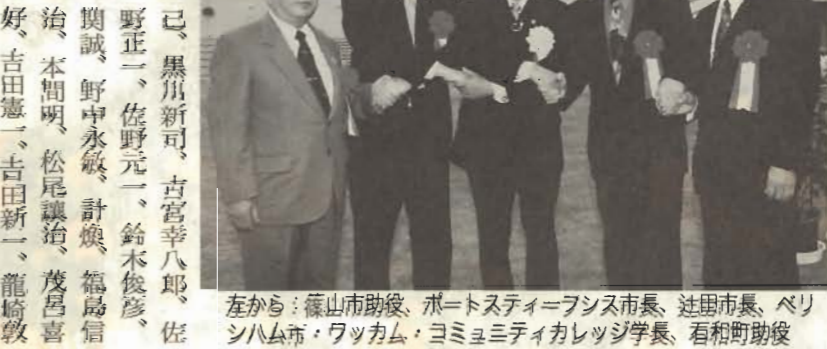
左から：篠山市助役、ポートステイブンス市長、辻内市長、ベリシハム市・ワッカム・ヨミュミティカレッジ学長、石和町助役

この後、姉妹都市・米國ベリシハム市と山梨県石和町、友好都市の静岡県ポートステイブンス市、兵庫県篠山市にそれぞれ友好楯を贈呈。それぞれの代表が握手を交わし、さらなる友好を誓い合いました。