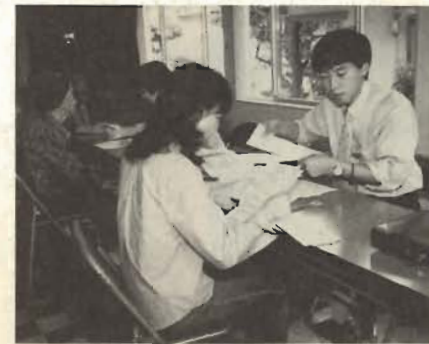
介護認定の申請＝那古地区公民館で