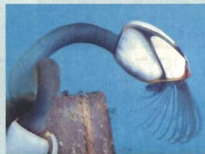
▲長い柄で流木についたエボシガイ