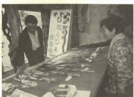
販売も組合員自ら

ムカゴと呼ばれる種イモから苗を栽培。プラスチック製の直径6センチ、長さ1・3メートルほどのパイプを二つに割り、U字型になったパイプに赤土を詰め、その中に苗(長さ4、5センチ)を一本ずつ植え付けます。これを15〜20度の傾斜をつけて20センチほどずらし、将棋倒し風に何本も重ねて埋めていきます。 3ヶ月ほどで1・3メートルほどに育ち、収穫までの2ヶ月で太さが増すといいいます。「じっくり育てる」のがコツ。 初年の千二百本から徐々に数を増やし、今年は1万本の収穫を見込んでいます。 値段は1本千五百円〜三千円