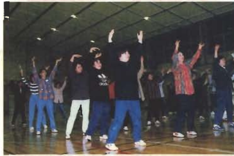
▼記念式典に向けて「花の館山」練習中

婦人スポーツクラブが産声をあげたのが昭和44年。今年でもちょうど30周年を迎えるんです。昭和39年のオリンピックでバレーボールが優勝し、全国的にもバレーボールが全盛期の時代。その影響もあって、設立2年後には、市内で41チーム、600人ぐらいの会員がいましたね。 今でも30年間、クラブでバレーを続けている人が5人いるんです。そのうち1人は、この30年間試合を休んだことも、ベンチに上がったこともないんです。ただ単に「バレーボールが好きだから」では、ここまで続けられないですよ。 いろんな人との出会いがあるんです。出会った人を通じて、また