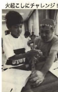
火起こしにチャレンジ!

市立博物館では、原始的な火起こしを体験する「歴史体験講座・火起こしにチャレンジ」の参加者を募集します。 対象は、小学校5年生以上(4年生以下は保護者同伴で可)。参加は無料です。夏休みの自由研究にもどうぞ。