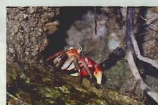
▲穴から顔を出すアカテガニ(♂)

アカテガニは海から陸に上がったイワガニ科の一種で、海に近い草原や湿地にすんでいます。川辺の土手や庭の石垣などに穴を掘ってすみかとする。 夏の夕暮れ時、アカテガニの大群が河口を目指して移動するのを見かけることがある。長い間かけて水から陸へとすみかを変えたこのカニも、一生のうち幼生期間だけは海に戻ってプラクトン生活を送る。そのため、母ガニは腹に抱いた卵の孵化