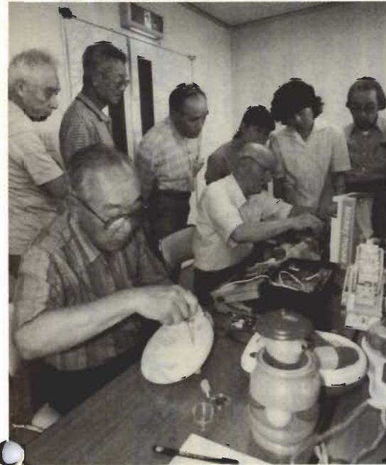
2人の講師に修理のこつを教わる参加者

毎月第2、第4水曜日に子どもたちにおもちゃの貸し出しや遊び場を提供している「館山おもちゃ図書館」では、貸し出し用のおもちゃが壊れてしまうこともしばしば。そこで、同館附属のおもちゃ病院を新設、おも