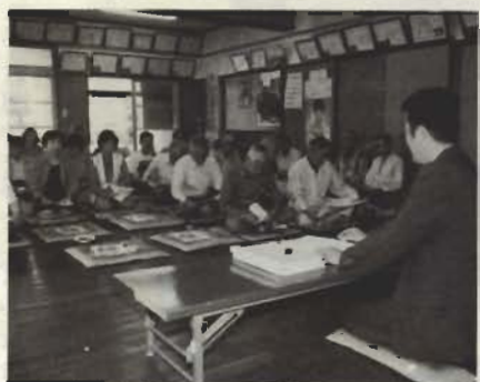
青柳青年館で行われた「介護保険講座」

イスクール推進事業」の一環として行われています。館野小学校では、鏡ヶ浦クリーンセンターや消防署などの見学に向講座を活用。第一中学校では、生徒たちが地域へ外出し、様々な体験を行う「レッツ・トライ生き方教育」の中で、市の観光や子育てについて、市職員から話を聞きました。