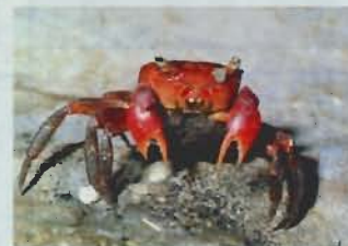
▲はち切れるように卵を抱えた母ガニ

アカテガニは海から陸に上がったイワガニ科の一種で、海に近い草原や湿地にすんでいます。川辺の土手や庭の石垣などに穴を掘ってすみかとする。 夏の夕暮れ時、アカテガニの大群が河口を目指して移動するのを見かけることがある。長い間かけて水から陸へとすみかを変えたこのカニも、一生のうち幼生期間だけは海に戻ってプラクトン生活を送る。そのため、母ガニは腹に抱いた卵の孵化