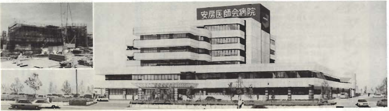
▼建設が進む安房医師会新病院

安房医師会では現在、来年春の完成をめざして「安房医師会新病院」の建設を進めています。館野地区山本の旧東市民運動場跡地に建設が進められている同病院は、すでに基礎工事、地下躯体工事を終え、4階躯体工事を行うなど、着々と工事が進められています。