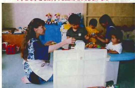
▼小さな子どもは何でも口に入れてしまいます

『おもちゃ図書館』の発会式を新聞で知って、少しでも役に立てればと参加したんです。すでに参加していた給食サービスのボランティアが軌道に乗ってきていたので、やってみようかなと思ったんです。13年前に活動を始めた頃の仲間は3〜4人でした。今では仲間も11人に増えました。中には、実際に自分の子どもが世話になり、恩返しをしたいからという人もいます。