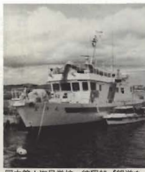
国立館山海員学校 練習船「望洋丸」

館山湾を船で周遊する「夏休み・親子クルージング」の参加者を募集します。 夏休みのひと時、親子でクルージングを楽しみながら、海から館山を眺めてみませんか。 国立館山海員学校の練習船「望洋丸」に乗船し、鷹の島付近から大房岬沖12kmのコースをまわります。下船後は、同校の施設見学も行います。お気軽に