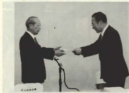
市長から諮問書を受け取る本間会長(左)