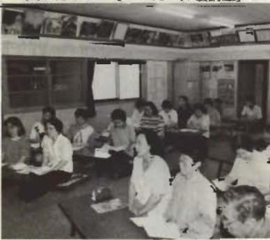
八幡青年館で行われた「介護講座」

5月申毎から申し込みを受け付け、先月末までにすでに60件の講座が行われました。 内訳は小・中学校34件、町内会や市民グループが14件。小・中学校では、教育委員会が開かれた学校づくりとして、地域の人材活用などを進めている「マ