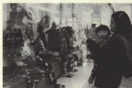
館山駅・自由通路の市民ギャラリー

▼掲示板/横1・1m、縦1・4mの大きさのパネルが6枚あり、ポスターなどが掲示できます(掲示板1枚または、その一