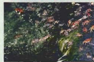
▲大潮の夕暮れ時、水辺に集まったアカテガニ