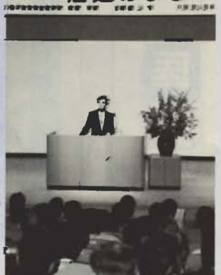
海辺のまちづくり

まちをきれいにし、まちの素材を活かした自分たちのための活動そのものが観光客にいい印象を与えるはず。これからのまちづくりは、一人ひとりが主役となり、ふるさとを演出することが大切」などと話していました。