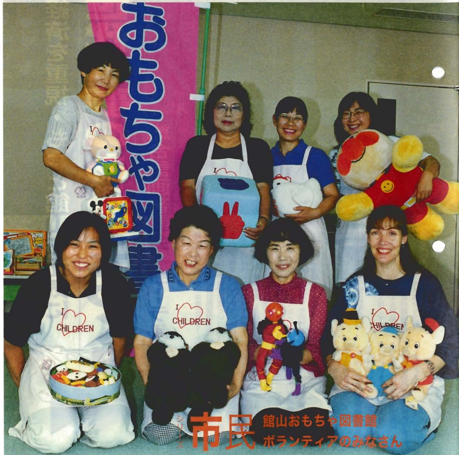
市民 館山おもちゃ図書館 ボランティアのみなさん