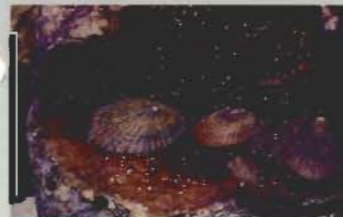
▲殻の色が美しいマツガイ

5月の声を聞くと磯の水も温み、「終日のたりかな」のように穏やかな目が多くなる。水温が15℃を越える頃、磯の生物も元気を取り戻し、餌探しや産卵のため活発に動き始める。