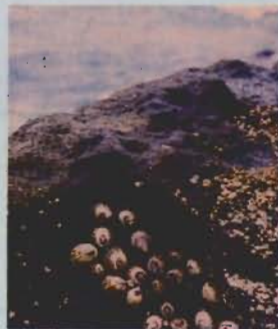
▲磯の高い位置にすむカサガイ

5月の声を聞くと磯の水も温み、「終日のたりかな」のように穏やかな目が多くなる。水温が15℃を越える頃、磯の生物も元気を取り戻し、餌探しや産卵のため活発に動き始める。