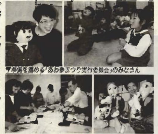
準備を進める「あわ夢まつり実行委員会」のみなさん

「お話会は、自分を表現する場 でもあるんです。今では、 ちよつとした色使いなど、演出 効果やしなげを考えるのが楽し い」と、必要に迫られてはじめ た教材づくりが、いつの日か自