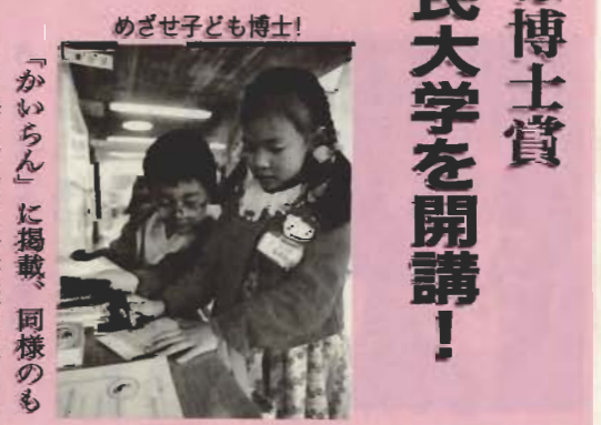
めざせ子ども博士!

分のライフワークに。 今年23日には南総文化ホール で、第1回目となる人形劇の祭 典「あわ夢まつり」を開催。 「保育園の先生が演じる紙芝居 から、房州弁のミニトークま で、いろんな人が出演します。 真方スタッフも一般募集したボ ランティア。今までの人形劇よ り、幅広いものができるはず。 みんなでテクニクを持ち合わ せ、お互いの刺激になればいい ですね」。