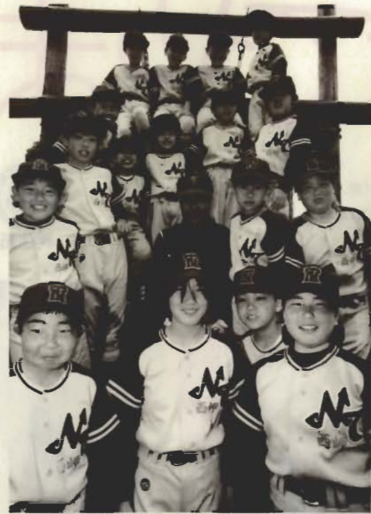
「明るさが持ち味」西岬トーショーズのメンバー

みなさんは、いくつのわらじを持っていますか。今月は、日常の仕事を持ちながら、自分のライフワークを見つけたい、「2足のわらじ」を上手に履いているみなさんを紹介します。テーマや方法、目標は全く異なり、一見すると、百人百様に見える4人のライフワーク。