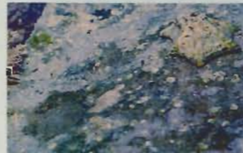
▲満潮時、家を離れてはい廻るウノアシガイ