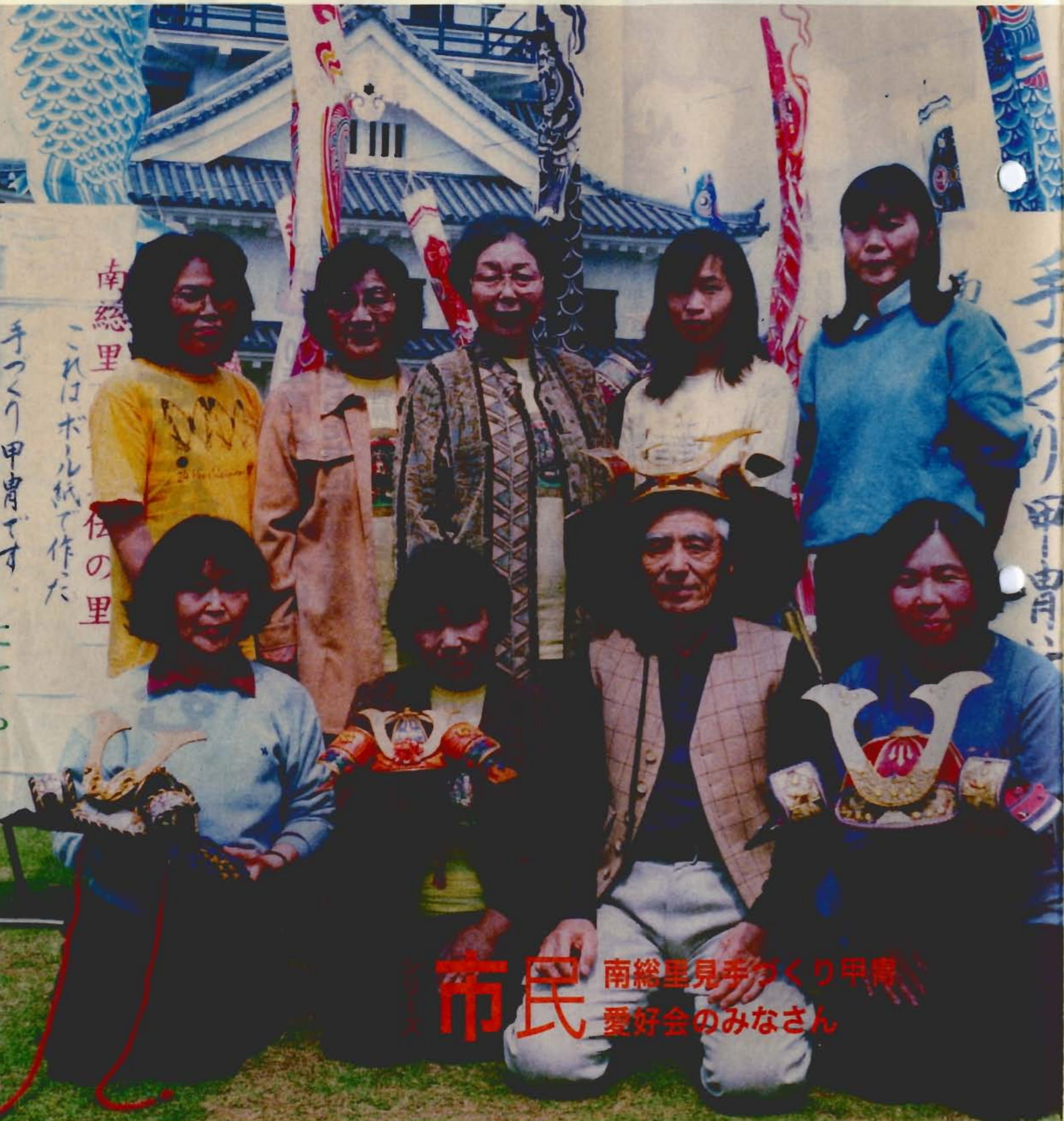
市民 南総里見手作り甲冑愛好会のみなさん