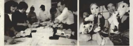
準備を進める「あわ夢まつり実行委員会」のみなさん

分のライフワークに。 今年23日には南総文化ホール で、第1回目となる人形劇の祭 典「あわ夢まつり」を開催。 「保育園の先生が演じる紙芝居 から、房州弁のミニトークま で、いろんな人が出演します。 真方スタッフも一般募集したボ ランティア。今までの人形劇よ り、幅広いものができるはず。 みんなでテクニクを持ち合わ せ、お互いの刺激になればいい ですね」。