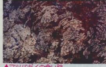
▲マツガイの食い跡

これらの貝の行動は潮の干満と関係がある。潮が引くと決まった場所で張り付くように動かず、潮が満ちると餌を探してはい回る。貝が付着する岩肌には、殻と同じ形のきれいなマーク(家)がついている。自分の家はきちんと場所が決まっているようで、いつでも同じ個体に戻ってくる。干潮時に、並んでいるカサガイにマーカーなどで番号を付け、順序を記録しておこう。翌日観察すると、殆ど個体が同じ家に戻っていることが分かるでしょう。(小池康之)