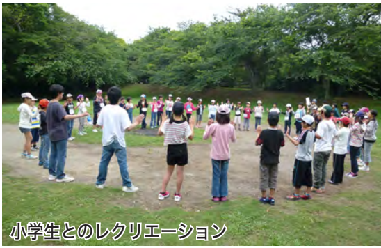
小学生とのレクリエーション

同クラブの一人一人には、 それぞれ「ギャンブネーム」 というお気に入りの呼び名 があり、活動中は、お互い を「ギャンブネーム」で呼 び合い、子どもたちと交流 する中で、親しみやすい雰 囲気作りに役立つています。