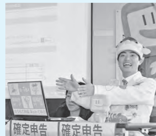
▲「e-Tax」を体験するさかなクン

税務署では、自宅・オフィス・税理士事務所などからインターネットを利用して申告・申請・届出・納税などができる「e-Tax(国税電子申告・納税システム)」の利用を推進しています。