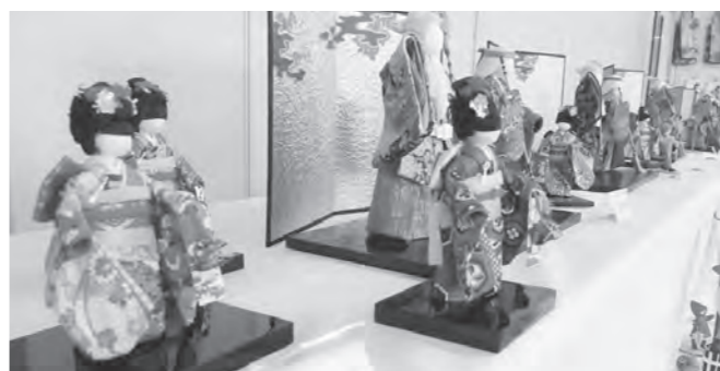
▲昨年の発表・展示の様子

中央公民館サークル連会の加入サークルと各地区公民館などで活動しているサークル(56団体)が、日ごろの活動の成果を展示、発表する「サークルフェスティバル」を開催します。日時/3月1日(土) 3日(月) 午前10時〜午後5時(3日は正午まで) 会場・内容/【コミュニケーションセンター】絵画、書道、木彫り、手芸、陶芸作品など、創作活動を行っている