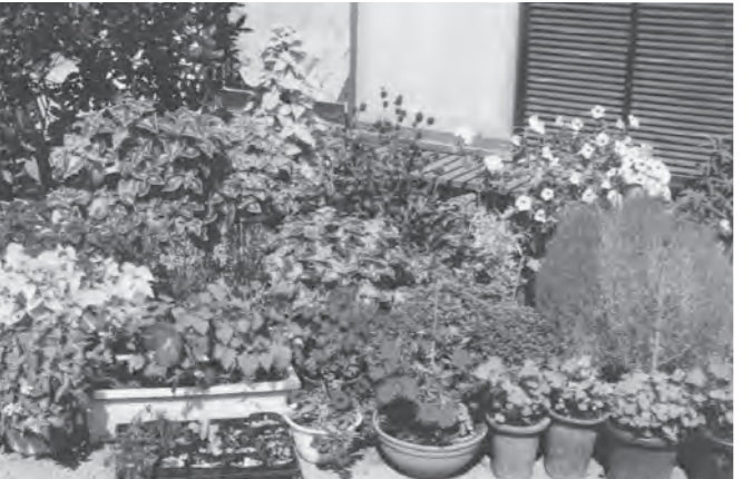
▲昨年の応募作品より

却しません。また、その著作権は、市に帰属します。②公道にはみ出しているものなどは、法令違反のものは応募から除外します。③合成写真は不可とします。