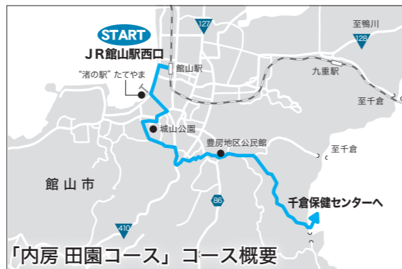
「内房 田園コース」コース概要