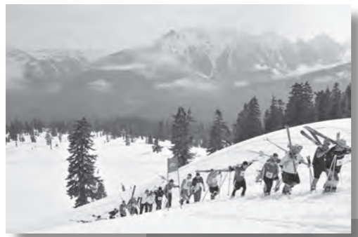
(上) クロスカントリースキー (中) マラソン (下) カヌー

館山国際交流協会ベリンハム委員会では、5月25日(日)に米国の姉妹都市ベリンハム市で開催される「スキー・トウ・シーレース」に参加する選手を募集します。 滞在期間中は、姉妹都市委員会メンバーなどの家にホームステイします。渡航費用などはすべて参加者負担です。 競技の概要／クロスカン トリースキー、ダウンヒルスキーまたはスノーボード、マラソン、自転車、カー、マウンテンバイク、シーカヤックの7種目8人によるリレー(コース全長約150キロ) 参加資格／ベリンハム市民との交流に興味があり、今後、交流に参加する熱意のある高校生以上の人 締切／3月10日(月) 申込み・問合せ／館山国際交流協会ベリンハム委員会事務局 北見(☎・FAX 23-0884、Eメール kinuyo@awa.or.jp)