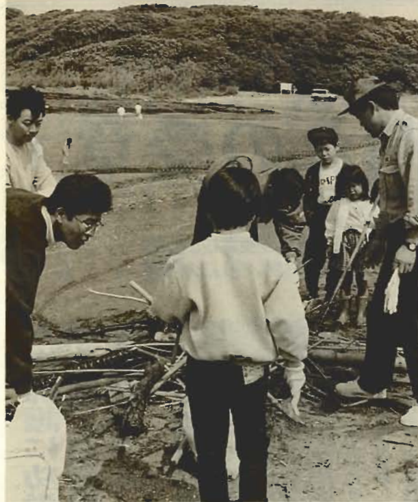
お父さんといっしょに大掃除—沖ノ島で—