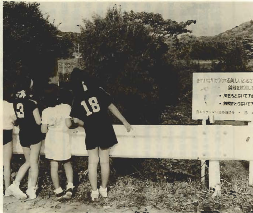
きれいな川が流れる美しいふるさと。錦鯉を放流します。 ・川を汚さないで下さい。 ・発砲をたばいて下さい。 川沿いの清掃活動

「昔は、この川でメダカや小ぶなをとったり、夏には泳いだりしたんですよ。思い出の川なんです。このきれいな川を、子どもたちに伝えていかなければ」と区長さん。