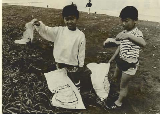
「このニールが目立つんだ」—那古海岸で—

市内一斉に、クリーン作戦が展開されました。町内会や子供会、老人会など各種団体から一万四千人が参加。道路わきの空き缶ひろいや、海岸清掃などに汗を流しました。この日集められたごみはおよそ22ト。このうち資源として再利用された空き缶、空きビン類は12ト。ふだんから「清潔で美しいまちづくり」をすすめています。ご協力ありがとうございました。