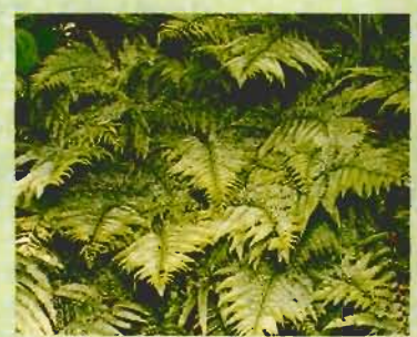
群生するイシカグマ

北条海岸から西方にうつそつと茂った森が展望される。濃緑の鷹ノ島公園のタブノキ林である。 森の中に入ると、樹高20以上のタブノキ(高木)の下にはヤブニツケイ、シロダモ(亜高木)が、さらにその下にはヤブツバキ、アオキ(低木)が見られる。地表はイノテ、フウトウカズラなどに覆われる。 3分の林内には、目の高さで直径50cm以上のタブノキが40本余あり、最大のもは150cmで、樹齢300年ともいわれる。その白っぽい樹幹には老木の気品がうかがわれる。県内有数の自然林である。これはタブノキが潮風に強く、さらに鎮守の森であることによる。