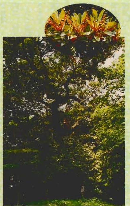
鷹ノ島のタブノキ林 円内はその新葉と丸い実

北条海岸から西方にうつそつと茂った森が展望される。濃緑の鷹ノ島公園のタブノキ林である。 森の中に入ると、樹高20以上のタブノキ(高木)の下にはヤブニツケイ、シロダモ(亜高木)が、さらにその下にはヤブツバキ、アオキ(低木)が見られる。地表はイノテ、フウトウカズラなどに覆われる。 3分の林内には、目の高さで直径50cm以上のタブノキが40本余あり、最大のもは150cmで、樹齢300年ともいわれる。その白っぽい樹幹には老木の気品がうかがわれる。県内有数の自然林である。これはタブノキが潮風に強く、さらに鎮守の森であることによる。