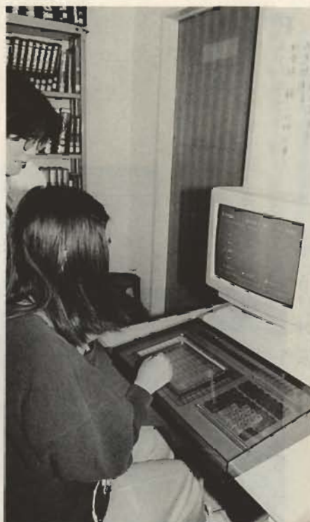
▲初めての人でも操作は簡単—利用者開放端末—