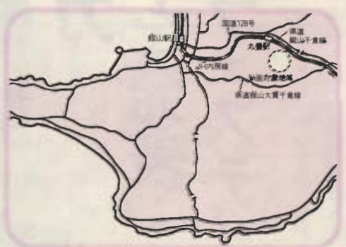
インダストリアルパーク位置図