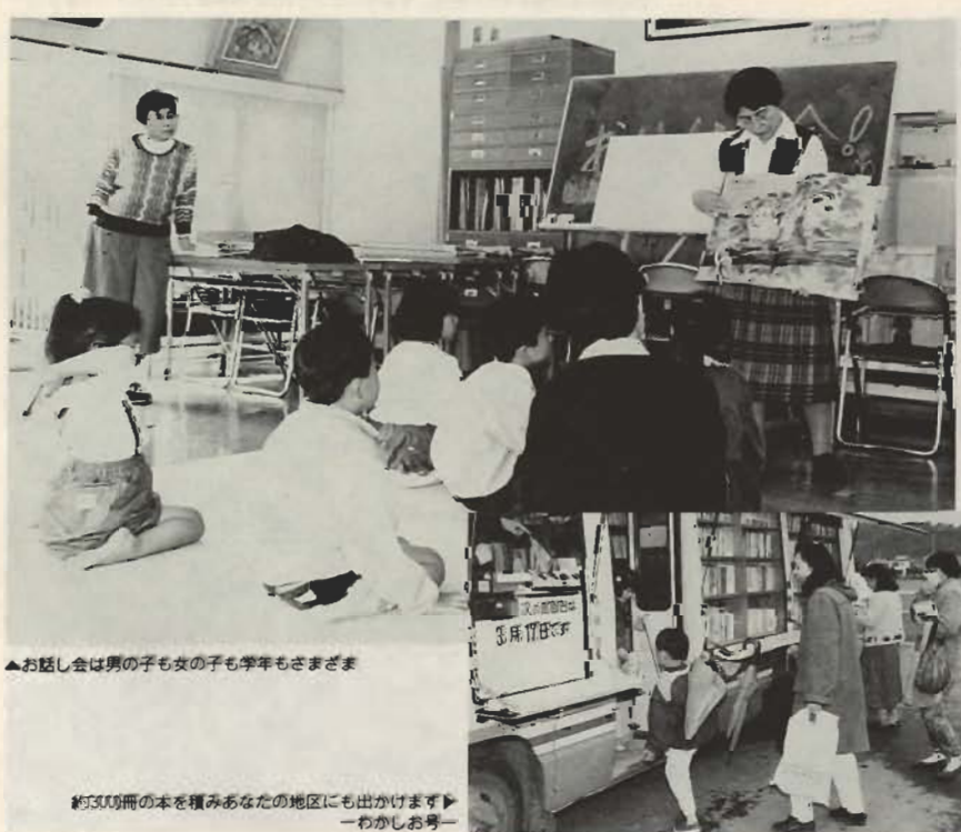
▲お話し会は男の子も女の子も学年もさまざま

ています。子どもたちは昔話や手遊び、紙芝居が大好き。会場ではボランティアのみなさんのお話しに、子どもたちが「喜」や「夢」で聞き入っています。4月からは、これまでの月2回を4回に増やし、毎週土曜日(第5週は休み)の午後2時から3時まで開いています。参加料は無料です。お気軽にご参加ください。