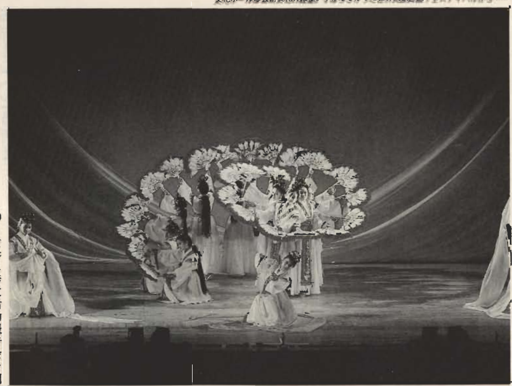
文化ホールは芸術文化の殿堂。すばらしかった世界民族舞踊フェスティバルから……

「館山市に文化ホール、鴨川市にコンベンションホールを建設する意向を、県が表明しました」と代表が経過を報告。南房総住民の会では、先月の