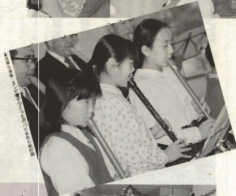
▼「国語の授業」エッセイのつづき、平家物語の巻頭も読まれた