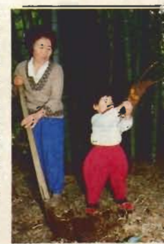
「ワーイ、やったやった。大きいおばあちゃん。竹の子はいいね」

この畑地区は、山間部の小さな集落ですけど、人情があつくて、好きなんです。となり近所で、助けあって生きています。すよ。一人暮らしのお年寄りの顔が見えないと心配で……。 私、お嫁にくるとき、誰でもいいから、人とあつたらあいいつしなさい。人の痛みを理解しなさい。って、両親にいわれたんです。 そのことが、ずっと心にありましたから、自分はもちろんですけど、2人の子供にも受け継