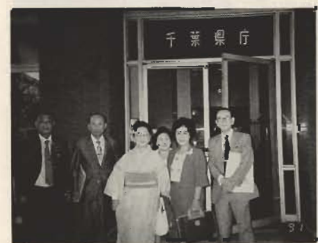
県に陳情、住民の会の皆さん

県立の地域文化ホール建設構想は、昭和62年に県が策定した『南房総地域半島振興計画』のなかで、地域文化の向上と地域経済の活性化をはかることを目的として、うちだされました。