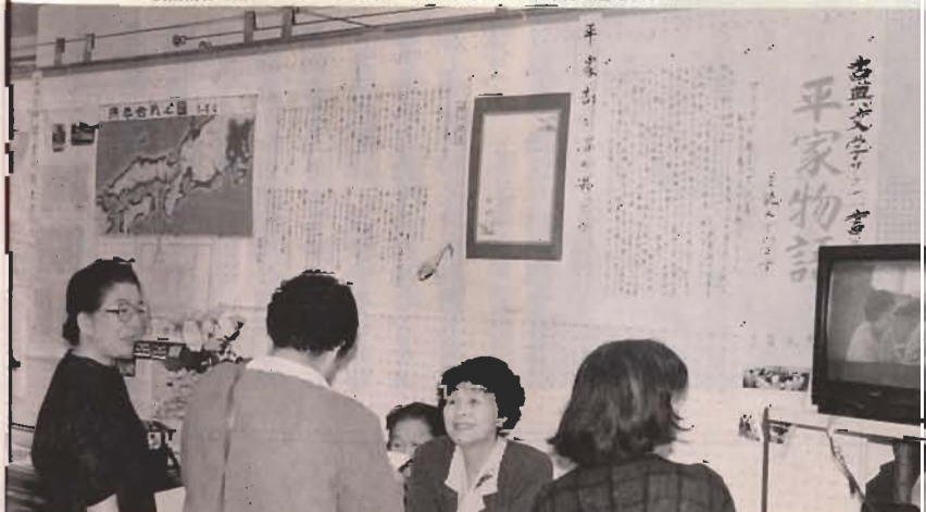
▼「紙糊の巻の巻」で平家物語に挑戦して、はやし年目を迎えました

にパネルディスカッションも行 われ、活気溢れるフェスティバ ルは大勢の市民でにぎわいまし た。 「集い、学び、むすぶ」が目標 の公民館サークル活動は、いま 着実にみんなのものになりつつ あります。