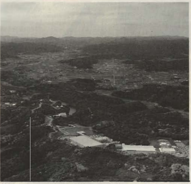
工業団地の建設が予定される館野・九重地区

計費などが計上されており、今後は3月県議会で議決を得て、館山インダストリアルパーク事業がスタートする見込みです。