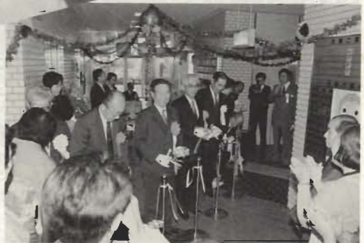
▲各種団体の代表も出席した開会式の様子