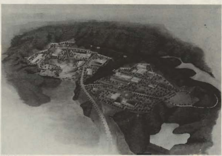
インダストリアルパークのイメージ図

県南初の工業団地として、魅力ある職場を確保し、若者の流出を防ぎ、バランスのとれた産業構造の実現が期待される館山インダストリアルパーク。この事業は、千葉県企業庁が主体となり、館山市と共に進めていきます。県では新年度予算案に当事業に関する予算を計上し、平成4年度からの事業化をめざしています。市も早期完成を目標に、地元のみならず関係団体との話し合いを進めています。