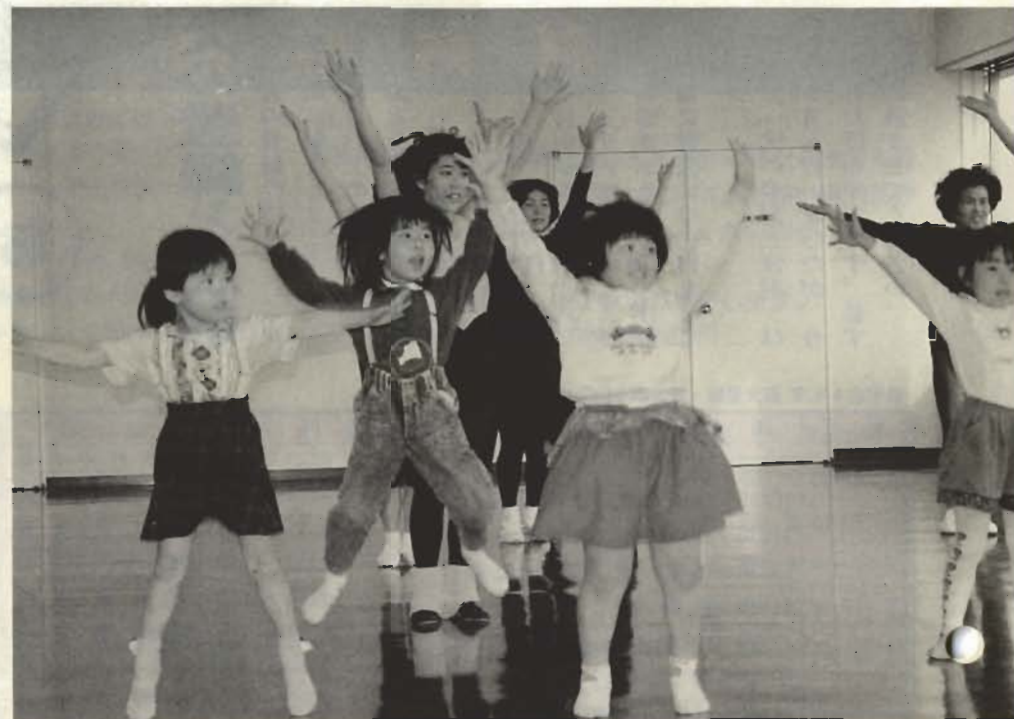
▲飛び入り参加の子どもたち。リズム感バツグンでワン・ツー・ジャンプ

「市民のひろば」への 投稿をお待ちします。 毎日の暮らしのヒント、身近な意見などを 400字以内にまとめてお送りください。 電話でもけっこうです。 あて先は、北条1145-1、 市役所市長公室広報係です。